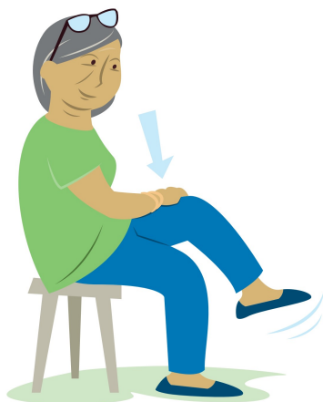
Bild och text till övningarna har inspirerats från broschyren "Styrk kroppen og let hverdagen – det er aldrig for sent!"