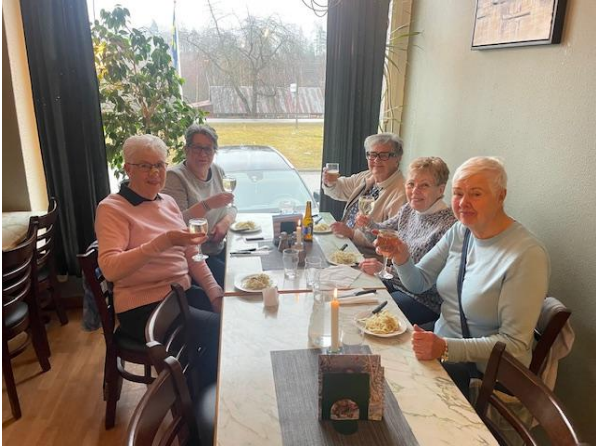
Mycket nöjda deltagare