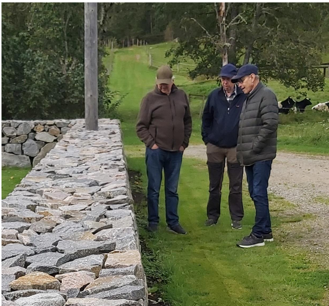
Det var en fin mur