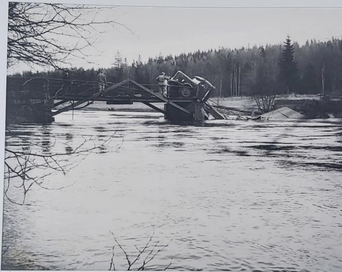
Bohults bro har rasat under lastbil 1961