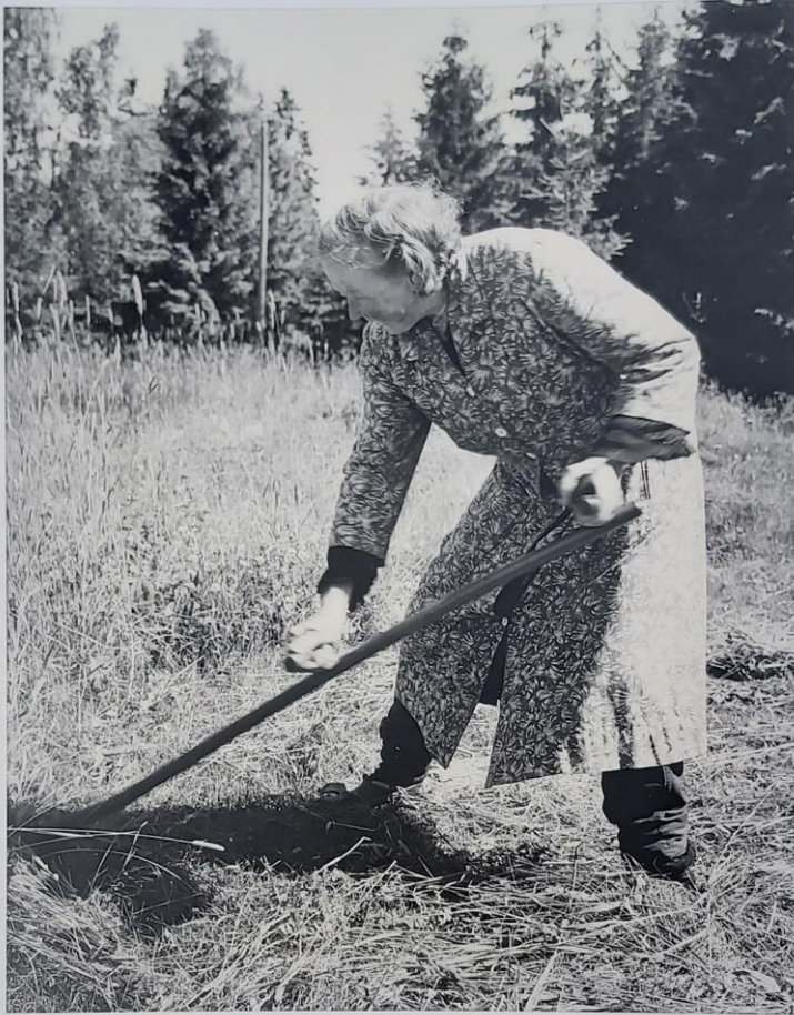
Alvida på Ängalund 1964 (ELVIRA)