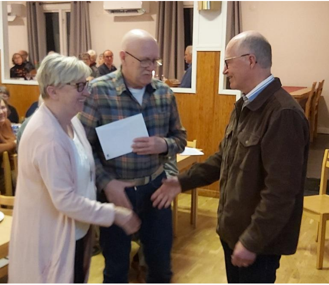
för att dom städar och sköter om vår SPF-lokal.