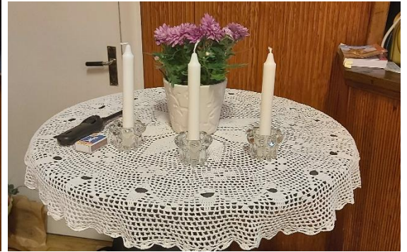
Parentation över 3 st avlidna medlemmar