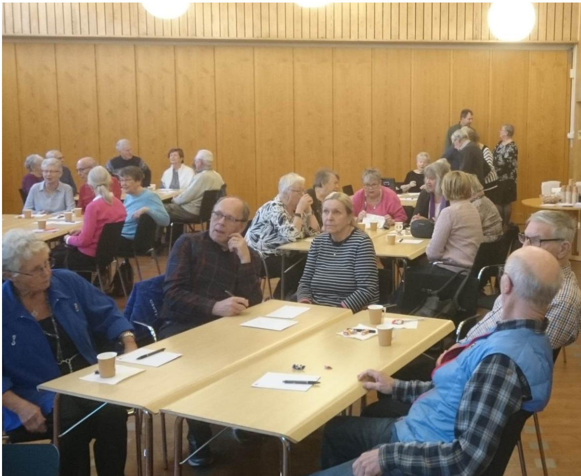
Folkhögskoledagarna 25 – 26 mars 2019