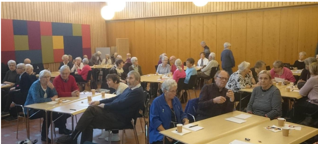
Folkhögskoledagarna 25 – 26 mars 2019