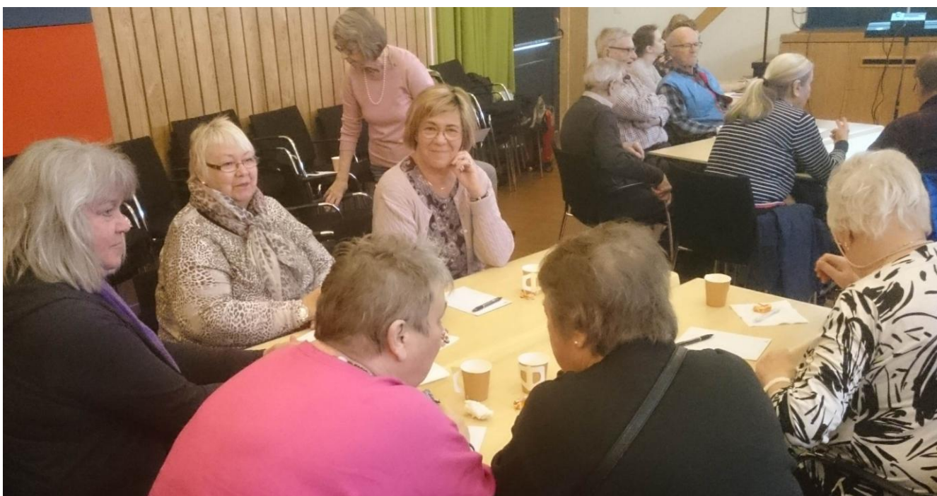
Folkhögskoledagarna 25 – 26 mars 2019