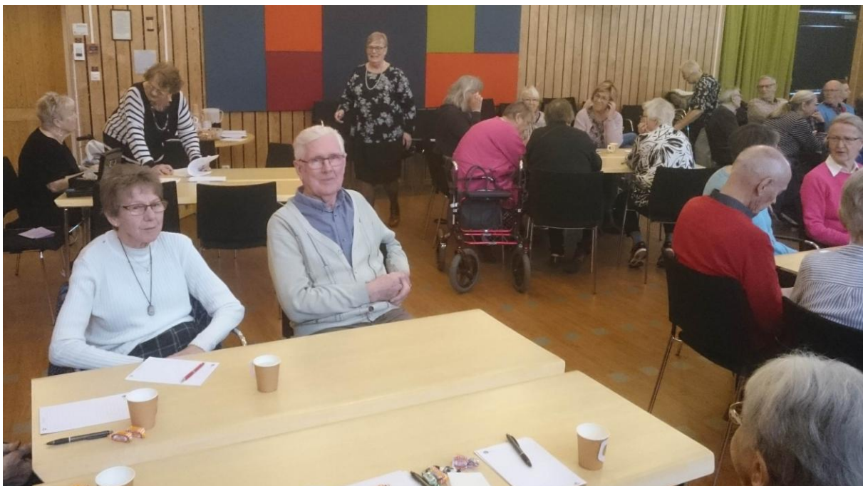
Folkhögskoledagarna 25 – 26 mars 2019