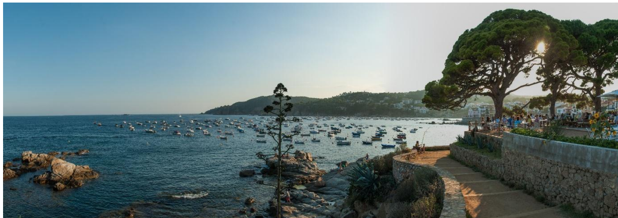
Calella med sin fina strand

Efter en god och varierad frukost samlas vi för en förmiddagspromenad i Calellas charmiga stadskärna. Vi får höra lite mer om stadens historia och strosa genom stadens gator, ser den lokala marknaden, små butiker och tar en fika där lokalbefolkningen vanligen möts. Lunch intas på egen hand idag. Passa på att prova en tapasbar eller ett strandnära lunchställe. Eftermiddagen är fri för avkoppling eller egna upptäckter. Hotellet ligger bara 150 meter från den fina stranden i Calella så kanske en promenad längs havet lockar? På kvällen samlas vi åter för en god middag på hotellet, där vi njuter av bufféns smakrika utbud och där vin och vatten ingår.