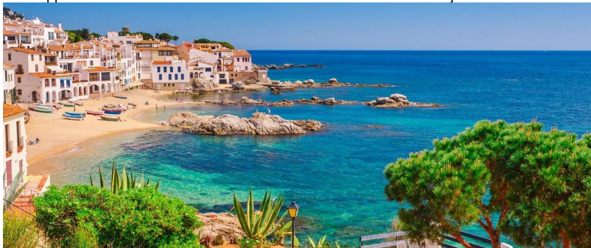
Vackra Costa Brava-kusten

Följ med SPF Tio Öar i Öckerö kommun på en oförglömlig resa till soliga Katalonien med historiska Barcelona med sin pulserande metropol och Andorra, det lilla landet inklämt i hjärtat av Pyrenéerna. Det blir en alla kontrasters resa där vi en dag upptäcker Barcelonas rika kulturarv med många intressanta ikoniska platser för att en annan dag bege oss till hjärtat av Pyrenéerna och besöka en av Europas högst belägna huvudstäder, Andorra la Vella. Vi kommer att förtrollas av Salvador Dalís surrealistiska värld och utforska charmiga kuststäder längs det glittrande Medelhavet, som Marc Chagalls blåa paradiset - Tossa de Mar, och vår egen lilla trivsamma ort Calella. Resan balanserar intressanta utflykter med tid för avkoppling. Vi bor bekvämt på det fina hotellet Amaika i badorten Calella, där poolområdet bjuder in till lugna stunder och avkoppling. Gastronomi blir en höjdpunkt under hela veckan med noga utvalda rätter på buffén för att spegla regionens kulinariska rikedom. Det blir en resa med konst, kultur, smakupplevelser och havets närhet som röda trådar. En resa för livsnjutare med andra ord!