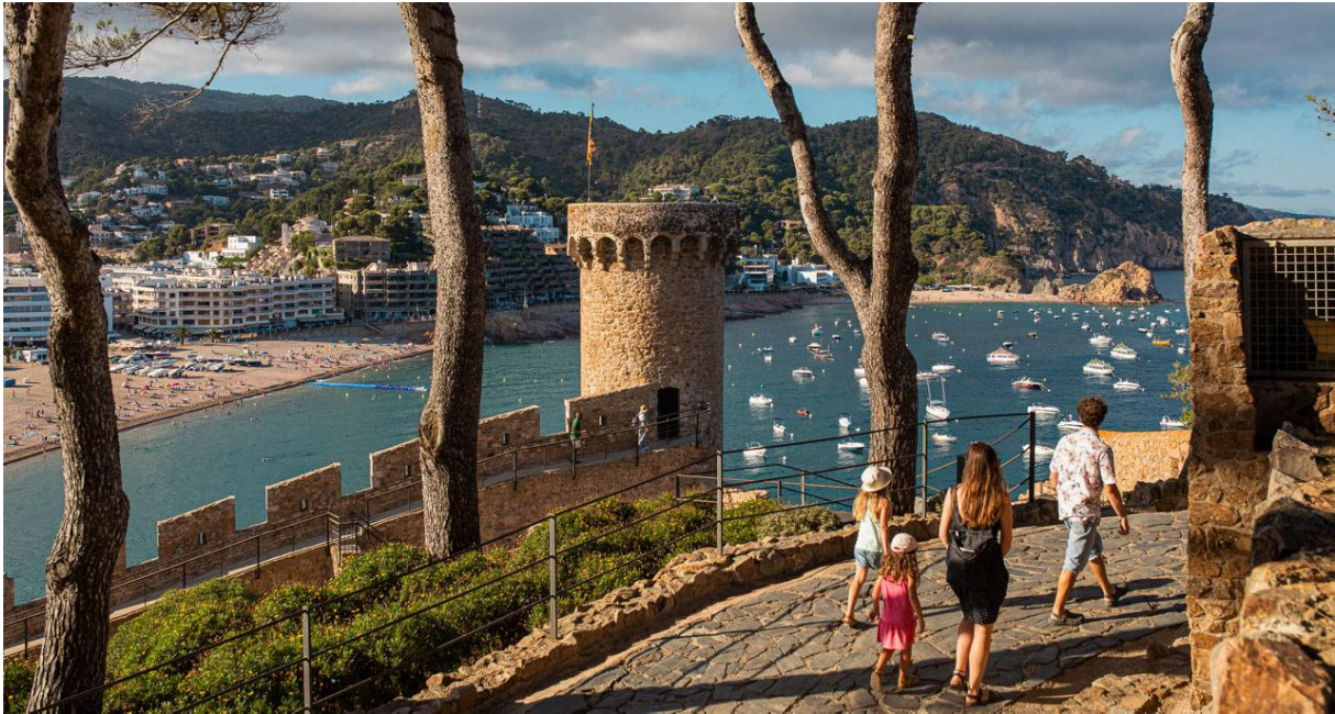
Tossa de Mar

dopp. Vi njuter av Tossa - Marc Chagalls blåa Paradis. Den vitryske konstnären tillbringade somrarna 1933 och 1934 i Tossa de Mar. La Vila Vella – Den Gamla Staden - tar oss tusen år tillbaka i tiden. Vi får tid att strosa omkring och äta lunch på egen hand idag. Vi vänder vi tillbaka med buss till hotellet efter en helt underbar dag.