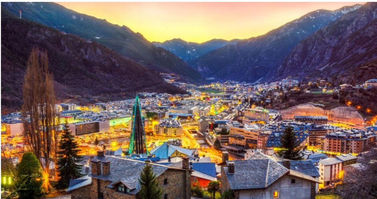
Andorras huvudstad Andorra La Vella

Vi startar dagen tidigt för att färdas i riktning hjärtat av Pyrenéerna där landskapet successivt skiftar från böljande kullar till dramatiska bergsryggar och vägarna blir allt smalare och slingrigare. Vid ankomst besöker vi Andorra la Vella, Europas högst belägna huvudstad och strosar genom de charmiga gatorna och tar en titt på Casa de la Vall, parlamentshuset från 1500-talet. Det blir en kontrast mellan gammalt och nytt. Lite tid för shopping naturligtvis då Andorra är känt för sina förmånliga priser på parfym, elektronik, mode och alkoholhaltiga drycker. Vi avnjuter en god traditionell lunch på en lokal restaurang innan vi vänder mätta och belåtna tillbaka till Calella och vårt hotell för lite senare middag.