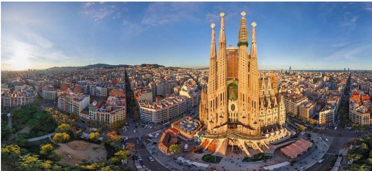
Barcelona - La Sagrada Familia

Efter en god frukost på hotellet åker vi idag till den historiska staden Barcelona. Vi njuter av bussfärden som startar med att åka en bit längs med den vackra kusten för att få en överblick av det populära området norr om Barcelona och väl framme i staden får vi sträcka på benen och ta en behaglig promenad upp till basilikan La Sagrada Familia av den berömda katalanske arkitekten Antoni Gaudí. Vi rundar kyrkan för att i detalj studera dess vackra och rikt utsmyckade fasader och fångas av en underbar och perfekt blandning av natur och arkitektur. Vi tar oss sedan vidare med bussen till hjärtat av Barcelona och den vackra boulevarden Paseo de Gràcia. Här får vi se Casa Batlló och La Pedrera. Vi njuter av en promenad längs med den kända gågatan Las Ramblas och tittar in i den livliga saluhallen innan vi tar oss till vår lunchrestaurang för att avnjuta en smakrik tapaslunch. Mätta och belåtna erbjuds vi lite tid på egen hand innan vi samlas för att fortsätta turen med att uppleva ikoniska platser som Plaza España och berget Montjuich med den fina Olympiastadion. Så småningom avslutar vi rundturen i Barcelona för att åka tillbaka till Calella för resans sista gemensamma middag