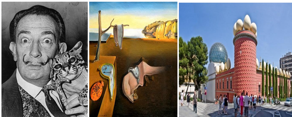
Salvador Dalí

Efter frukost bär det iväg till Salvador Dalí's födelsestad Figueres och hans fantastiska museum. Det blir en djupdykning i Dalí's surrealistiska och bisarra värld, hans unika personlighet och stil som präglar all konst samt hela byggnaden i sig. Ett extremt roligt museum att utforska och enligt Dalí själv; "Jag försöker skapa fantastiska ting, magiska ting, drömlika ting. Världen behöver mer fantasi. Vår civilisation är alltför mekanisk. Vi kan göra det fantastiska verkligt och då blir det verkligare än det som faktiskt existerar." Besöket blir en sann upplevelse! Vi avnjuter en härlig lunch med vin i medeltida byn Peralada. Mätta och belåtna avslutar vi dagen med ett besök hos den kända vinproducenten Celler Peralada med en historia som sträcker sig tillbaka till 1923 och är en del av det anrika Peralada-slottet, som har varit en central punkt för vinproduktion och kultur i århundraden. Här blandas tradition och innovation och vinerna speglar regionens unika terroir med viner och cava av högsta kvalitet. Vi avslutar med vinprovning och en liten promenad i Peraladas medeltida stadskärna. Efter en alla sinnenas dag vänder vi nöjda tillbaka till hotellet för middag.