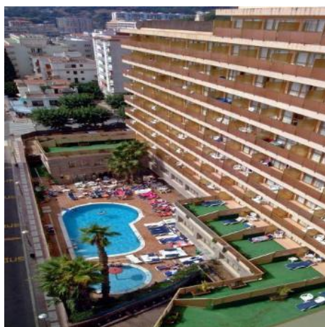
Vårt fina hotell

För allas trevnad försök vara så doffria som möjligt. Tänk på våra allergiker