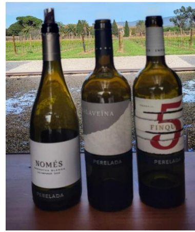
Den fina vingården Perelada med sina goda viner