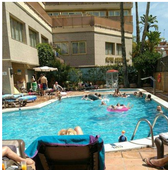
Poolen på Hotel Amaika