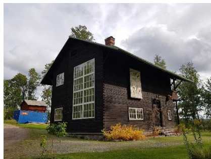
Rackstadmuseet i Arvika