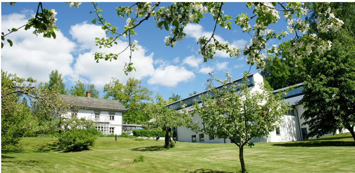
Rackstadmuseet Arvika