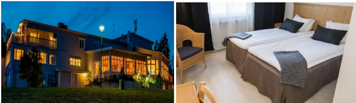
Vårt hotell Frykenstrand