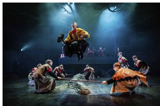
Berättarladan – Västanå Teater