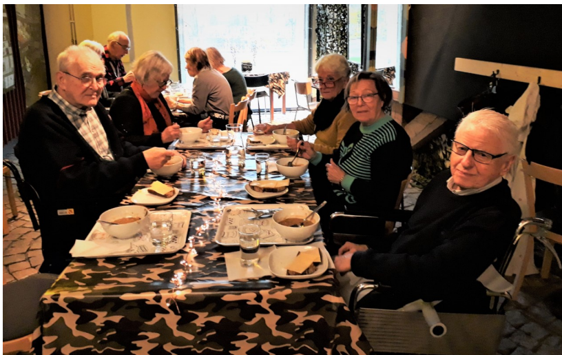
Slutligen är vi en jättegod ärtsoppa och nygräddade pannkakor. Det blev en fin avslutning på ett givande studiebesök.