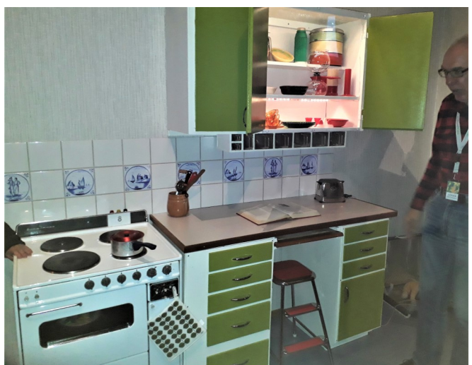
Ännu mer nostalgi mötte oss när vi kom in i ett 60-talskök. Vem minns inte kaffebryggaren Don Pedro och de höga kakburkarna?