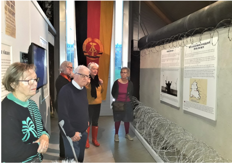
Berlinmuren byggdes 1961 och delade Berlin. Den revs 1989. En bit av muren finns bevarad.