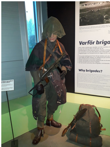
Så här var en soldat klädd färdig för strid på 50-talet.