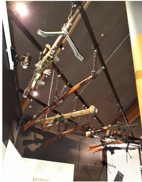
Olika vapen hängde i taket bl.a. en bazooka, uppkallad efter blåsinstrumentet bazooka.