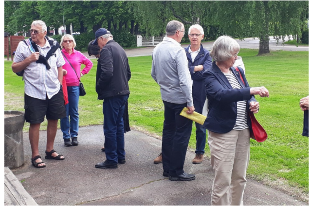
I väntan på avfärd till vårt nästa mål: Monica Zetterlunds museum i Hagfors