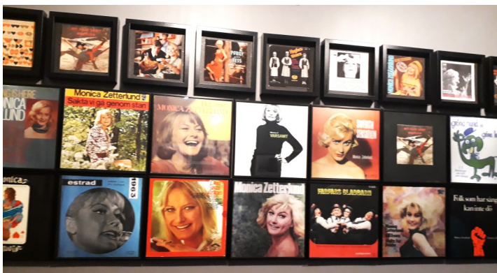
Monica spelade in ett stort antal skivor