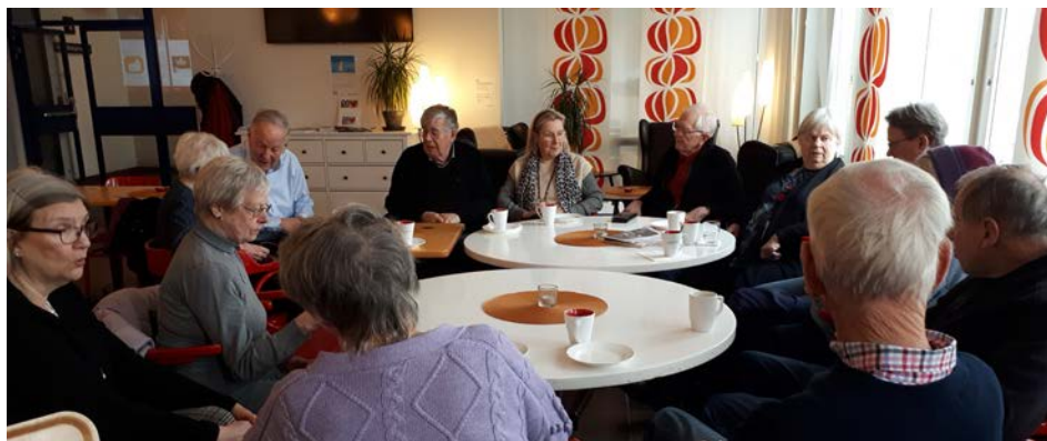
Den 30 januari träffades 14 pratglada seniorer och fikade tillsammans

Pensionärsföreningarna SPF Tibbleseniorerna och SPF Jarlabanke i samverkan med Tibble Kyrka