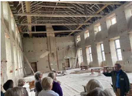
Den ofullbordade balsalen

När man ser denna sal blir man förundrad över den fina byggteknik och de verktyg som de hade redan på den tiden.