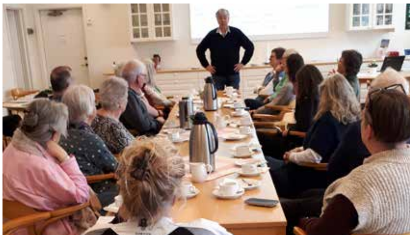
Möte med nya medlemmar