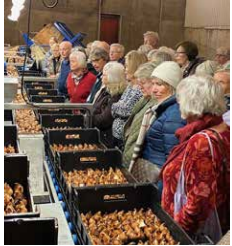
Text och foto: Gunilla Rönholm

Upplivade av den kommande tulpan-säsongen tog vi farväl av Pelle och tulpanerna.