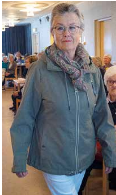
Eva Neveling

Charlotta Fagerland kunde självklart alla detaljer kring tillverkning, kvalitet och tyger, men lämnade också personliga synpunkter på färger och stil. Det väckte uppskattning och även munterhet.