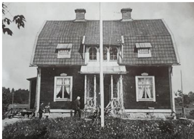
Mangårdsbyggnaden på Tibble Gård där Täby Centrum ligger idag.

Tibble är ganska vanligt namn i Täby på stora, gamla bebyggelser. Så är fallet även i Uppland och här skrivs det första gången 1356 som Thigbile . Efterleden bile bör vara ordet byle som står för boplats, gård e.d. Utifrån förleden Thik = tjock har namnet oftast tolkats som den tjocka , dvs. den stora eller tät bebyggda byn . Men det finns också forskare som menat att förleden skulle kunna betyda tät skog och att Tibble helt enkelt står för bostaden i skogen . Oavsett vilken tolkning som är den rätta passar onekligen begreppet ” den tät bebyggda byn ” mycket väl in på dagens Tibble .