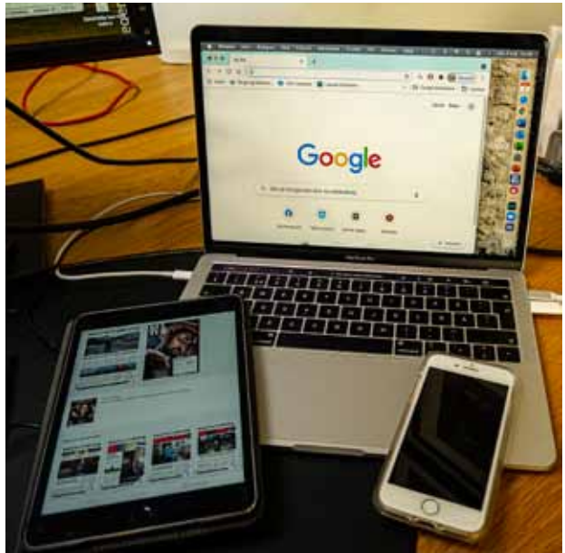
Ingen ovanlig syn i många familjer: bärbar dator, surfplatta och mobiltelefon.

Årsmöten, bokcirklar och olika föreningsmöten har