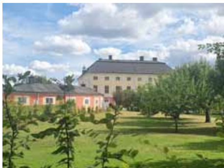
Ekolsunds slott i som-margrönska.

Anmälningsavgiften insättes på SPF Tibbleseniörernas plusgiro 477 28 94 – 4 senast 2 september.