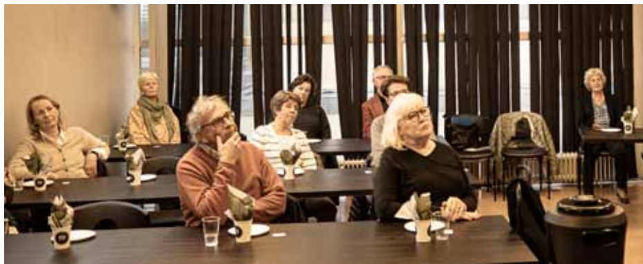
Nära hälften av årets nya medlemmar kom till Tibblehallens konferensrum.