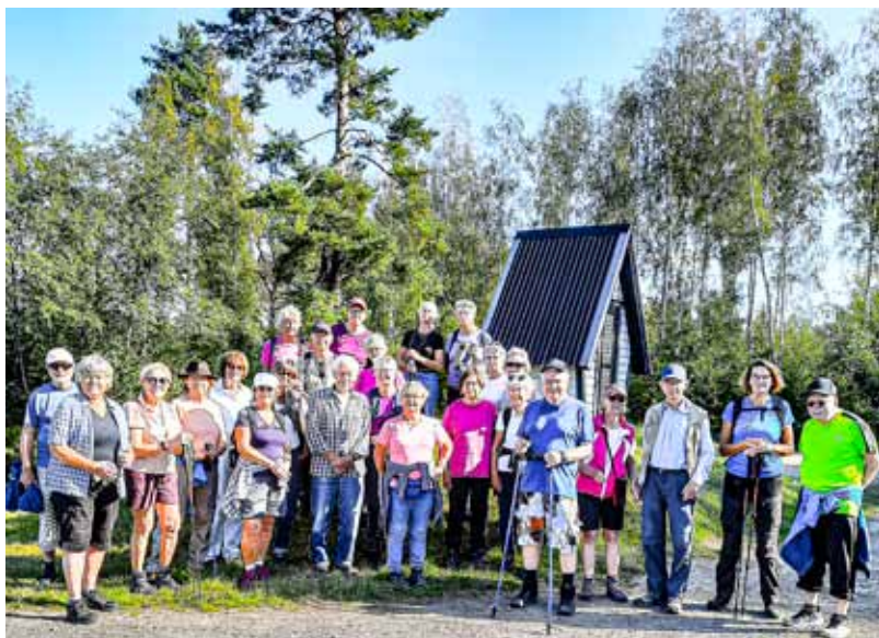
Hela vandringsgruppen har ställt upp sig för fotografering i solskenet.