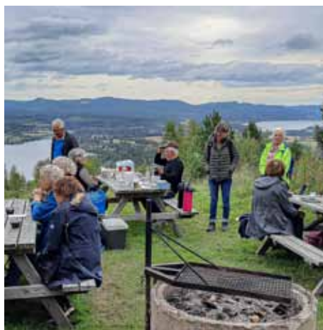
Lunchpaus på Åsbergets topp.

FOTNOT. Fler bilder från resan finns på Tibbleseniörernas webbplats, www.tibbleseniörerna.se