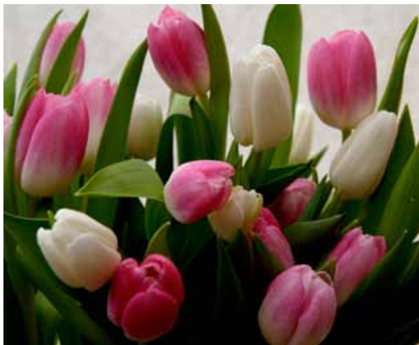
Massor av tulpaner får vi se på utflykten till Rydells.

Bussen går 11.00 och kommer åter till Täby Galopp ca 15.30.