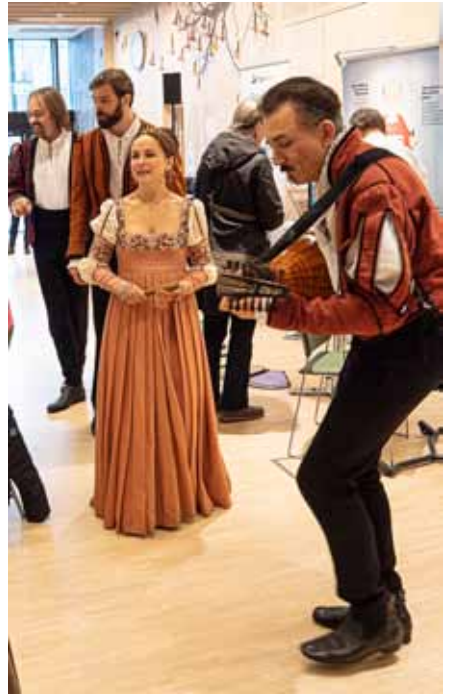
Underhållning med medlemmar ur Romeo- och Juliakören.