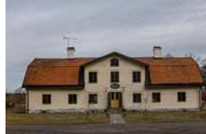
Linnéa Sallay, som både sjunger och spelar fiol, tar oss med på en slottstur i Uppland. Första uppehållet under dagsturen blir på Ekolsunds värdshus och sen blir det visning av själva slottet.