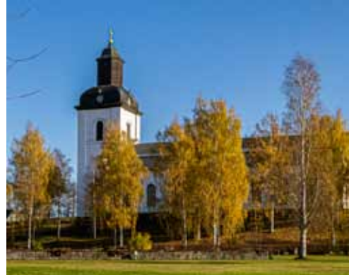
På resan till Hälsingland får vi både besöka karaktäristiska hälsingegårdar och vackra kyrkor. Järvsö kyrka, som ligger på en ö i Ljusnan, är landets största landsortskyrka med plats för cirka 3.000 besökare.