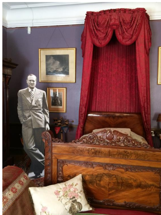
Kingasängen där bl a Oskar II brukade sova