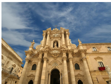
Katedralen i Syrakusa

Dag fyra far vi till Etna som är Europas högsta aktiva vulkan. Vi provar viner och äter lunch på en lokal vingård innan vi återvänder till Naxos. Kvällen fri.