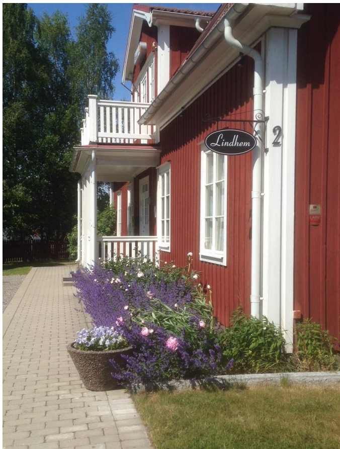
Lindhem, Örvägen 2. Här finns vår expedition samt lokaler för cirklar och mindre möten..