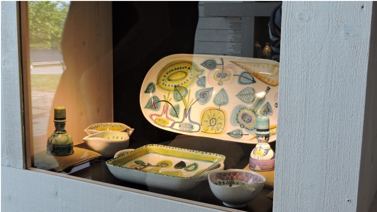
Text och foto: Vivianne och Per-Olof Martinsson.