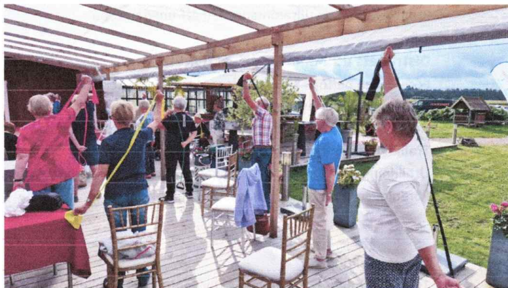
Den dagliga morgongympan på Charlottenlund