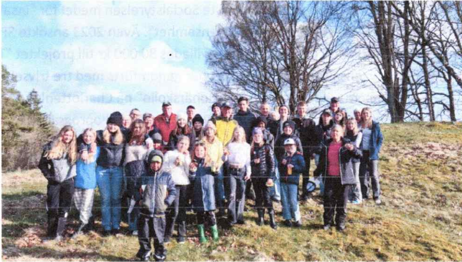
Projektavslutning tillsammans med 4H-ungdomarna

vid Carussedammen till en permanent discgolfbana för alla att använda. Röjningsarbetet är snart avslutat och endast mindre arbeten återstår till dess banan kan tas i bruk. Vi har även tilldelats en s.k. landsbygdscheck på 20 000 kr från Varbergs kommun för ändamålet.