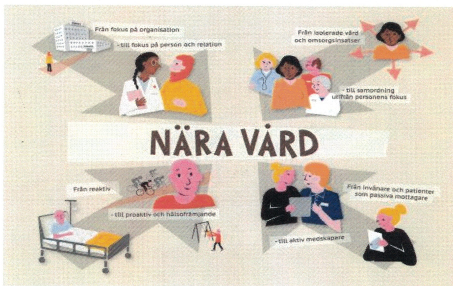
Figur 3: Sveriges kommuner och regioner, 2021

Omställning till nära vård kommer att påverka hur kommunen som helhet arbetar med hälsa, vård och omsorg. Detta är en förflyttning som redan har börjat ge en påverkan på socialnämndens verksamheter. Framförallt på grund av att patienter skrivs ut i tidigare skeden från slutenvården för att rehabiliteras med hjälp av primärvården och den kommunala hälso- och sjukvården. För att möta denna förskjutning måste verksamheterna se över sina arbetssätt och vilka kompetenser som behövs och göra förändringar som krävs för att säkra grunduppdraget.