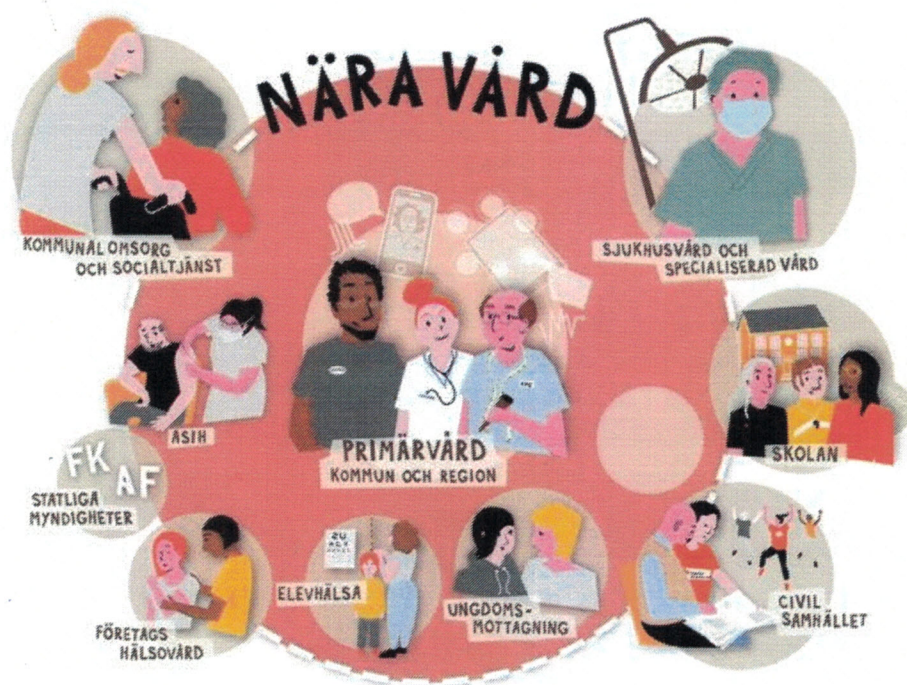
Figur 2: Sveriges kommuner och regioner, 2021

Utvecklingen inom vården går mot att färre resurser ska kunna räcka till fler som behöver hjälp. För att möta detta är Nära vård ett nytt sätt att arbeta med hälsa, vård och omsorg. Nära vård innebär en förskjutning av vården närmare individen. Den närmsta vården är den som patienten/brukaren kan ge sig själv – egenvården – samt det stöd kommuner och regioner kan ge för att möjliggöra detta. För att lösa detta måste hela samhället bidra genom att arbeta mer förebyggande, samarbeta över gränser och utgå ifrån varje individs behov.