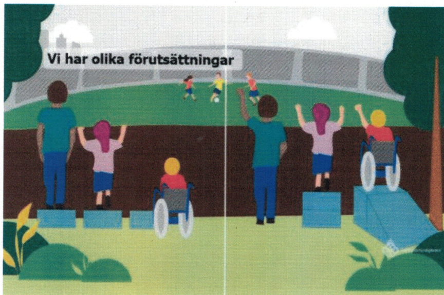
Figur 1: Folkhälsomyndigheten, 2021

I kommunallagen står det att kommunen måste tillämpa likställighetsprincipen, som innebär att alla kommuninvånare ska behandlas lika. Socialtjänstlagen ger dock utrymme att göra undantag ifrån detta för att ge det stöd som varje individ behöver. För att alla kommuninvånare ska ha en skälig levnadsnivå behövs olika stöd för olika individer. Det är alltid individens behov som styr vilket stöd som kommunen är skyldig att bistå med. Personer med olika behov får olika stöd, för att de ska hamna på en mer jämlik levnadsnivå. Vissa har rätt till mer, och vissa har rätt till mindre.