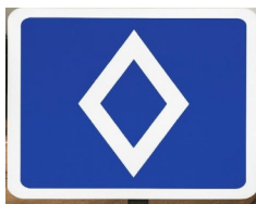
körfält för viss typ av fordon