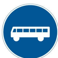
körfält för buss