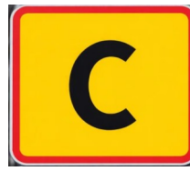
förbud mot trafik farligt gods i tunnel