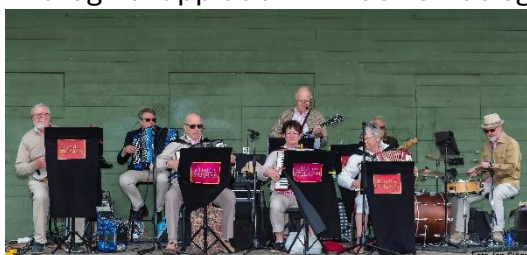
Kumla spelmän under framträdandet

Efter en genomgång av dagens fortsatta program tog Kumla spelmän över scenen. Redan soundchecken väckte publikens entusiasm när den välkända Harry Brandelius-melodin "Han hade seglat för om masten" drog ner applåder till musikernas egen förvåning.