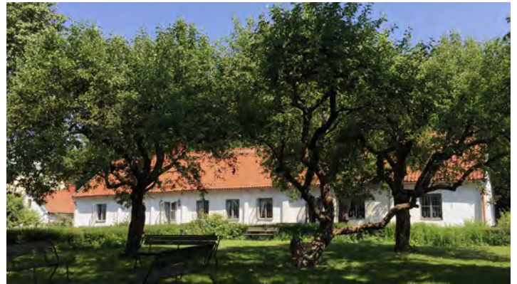
Charlottenburgs gröna trädgård.

Max 40 pers. Pris 50 kr som betalas på plats. Anmälan till expeditionen senast 12/9.