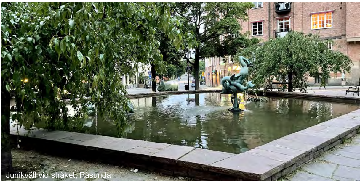
Junikväll vid stråket, Råsunda