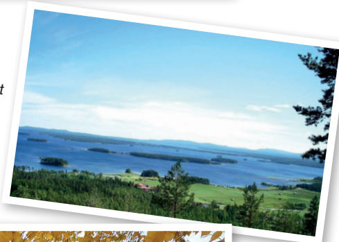
Utsikt från Avholmsberget