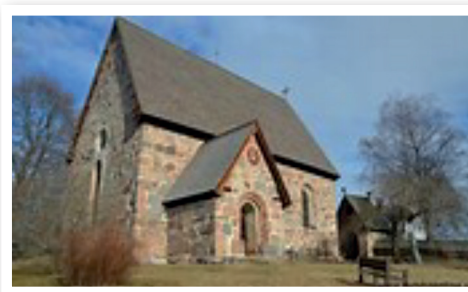
Trönö gamla kyrka

(Ingrid ej tillgänglig 13-28 april). Sista anmälningsdag 25 juli.