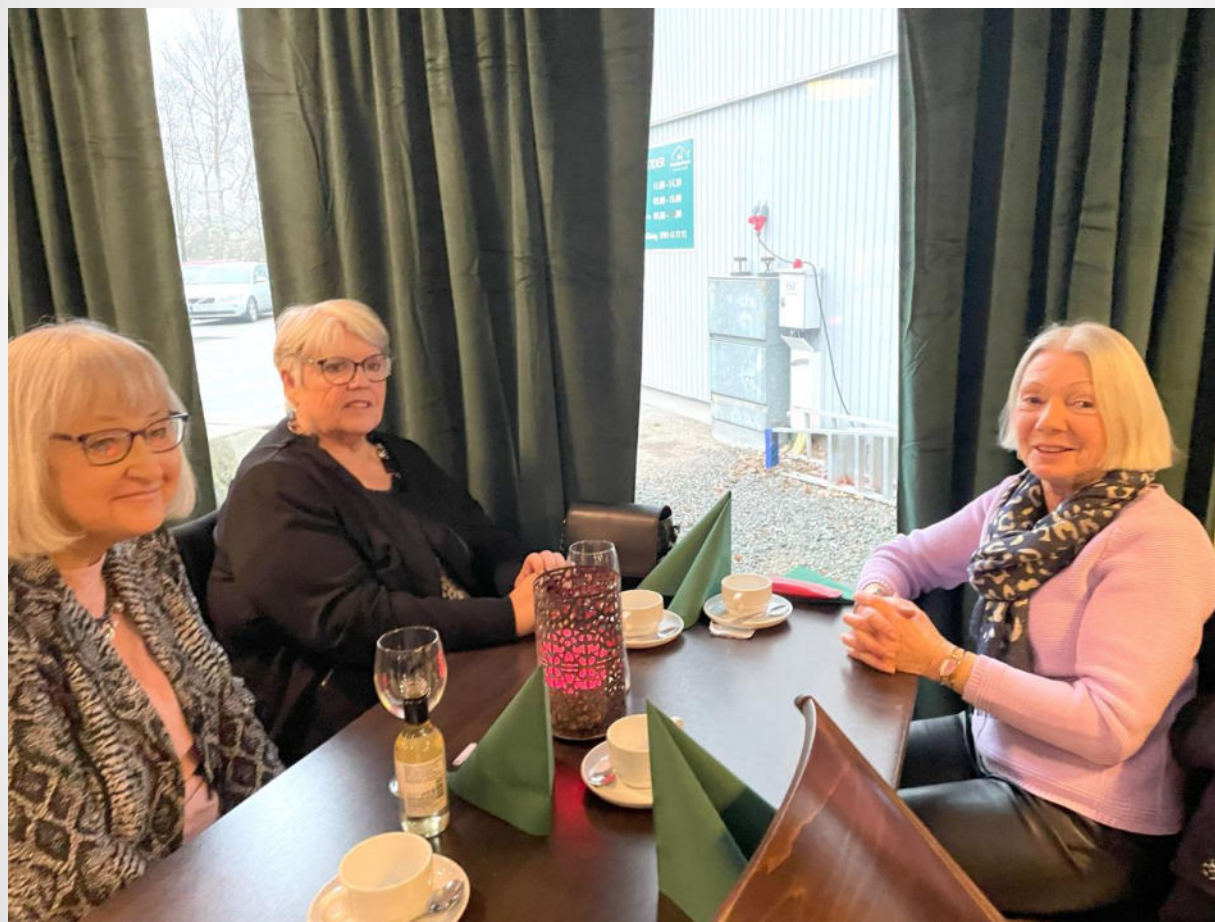
Ytterliggare tre vackra damer!