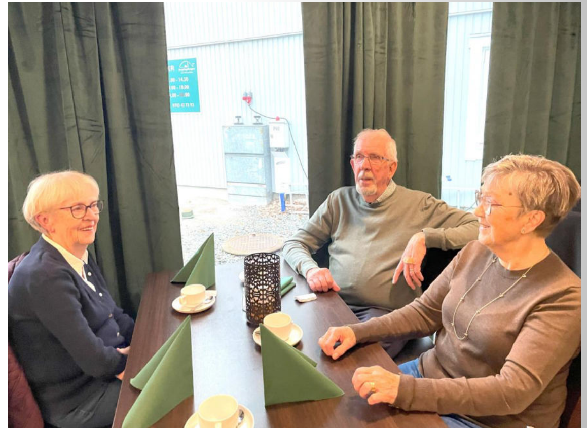
Olofsson med två vackra damer!