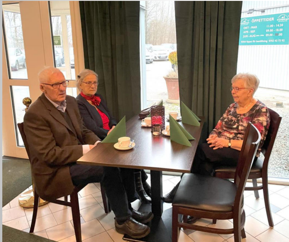
Pettersson med två vackra damer!

Många SPF:are träffades denna kväll för god mat och dryck, bra musik, trevligt sällskap vid borden. Det bjöds på många härliga skratt under kvällen.