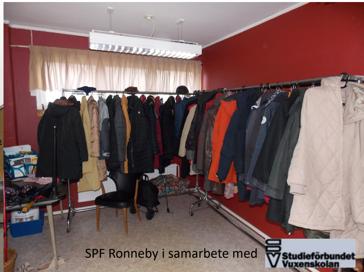
SPF Ronneby i samarbete med