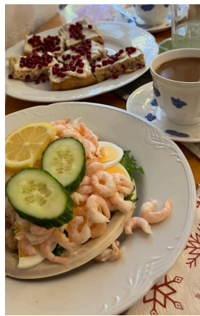
De flesta hade valt räkmacka!

Seniorer och läkemedelsanvändning, ett ytterst angeläget ämne i vår ålder. Hon uppmanade oss att ha koll på läkemedel, Läkemedelskollen (E-hälsomyndigheten, vårdguiden 1177 eller Apoteket). Fass och Kloka listan/råd är andra. Ett samarbete finns mellan Apoteket, PRO, SPF Seniorerna och SKPF.