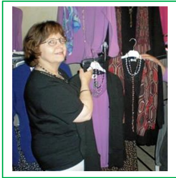
18 maj Modevisningar