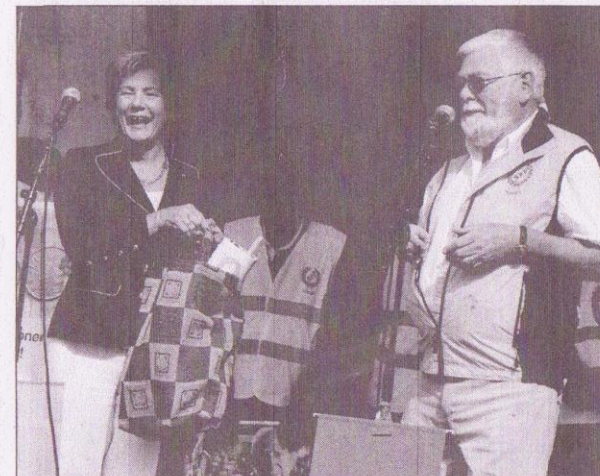
Äldre- och folkhälsominister Maria Larsson kom till Nässjö och tog emot pensionärernas budkavle från pensionärsbasen Evald Larsson.