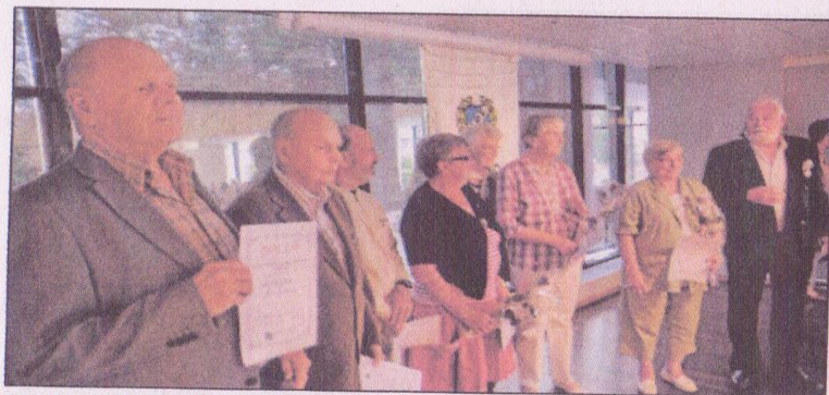
De utvalda medlemmarna kallades upp på scenen och fick motta Silvernålen, ett hedersdiplom och blommor.

Silvernålen delas ut till medlemmar som varit med i minst