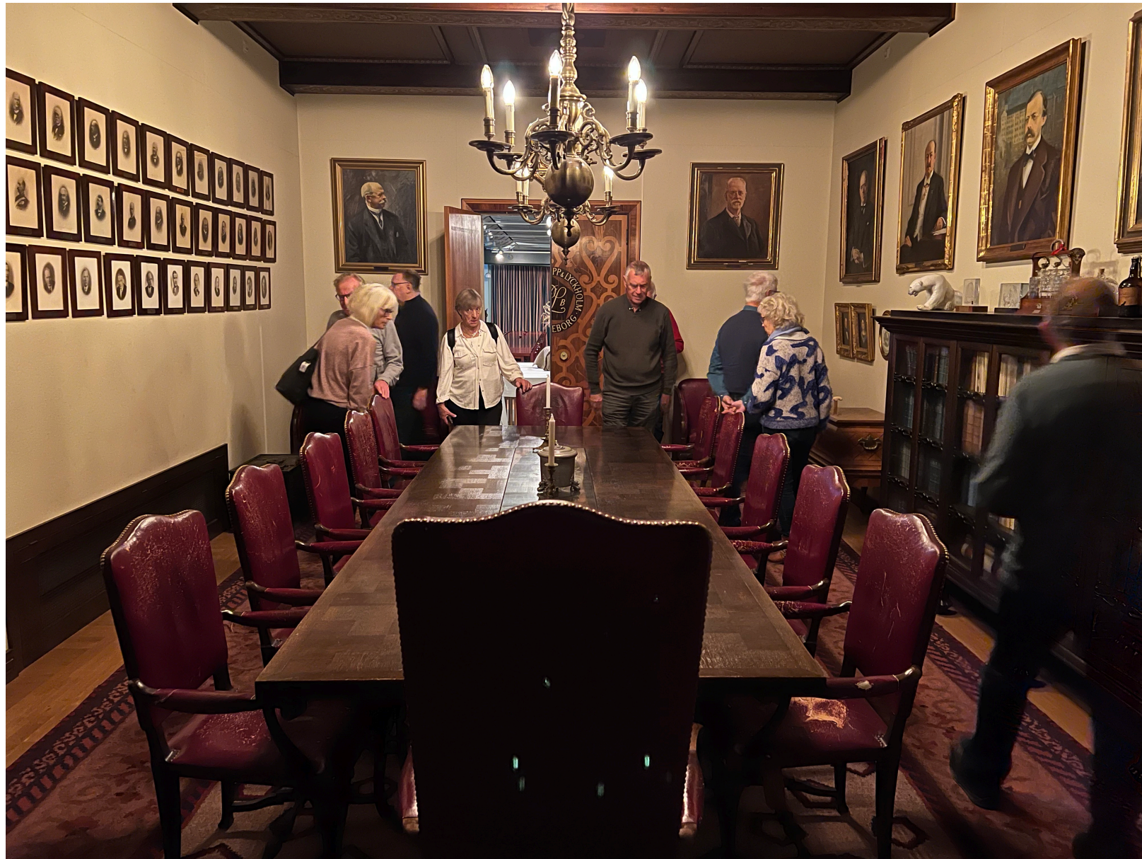
Styrelserummet på gamla Pripps Bryggeri.