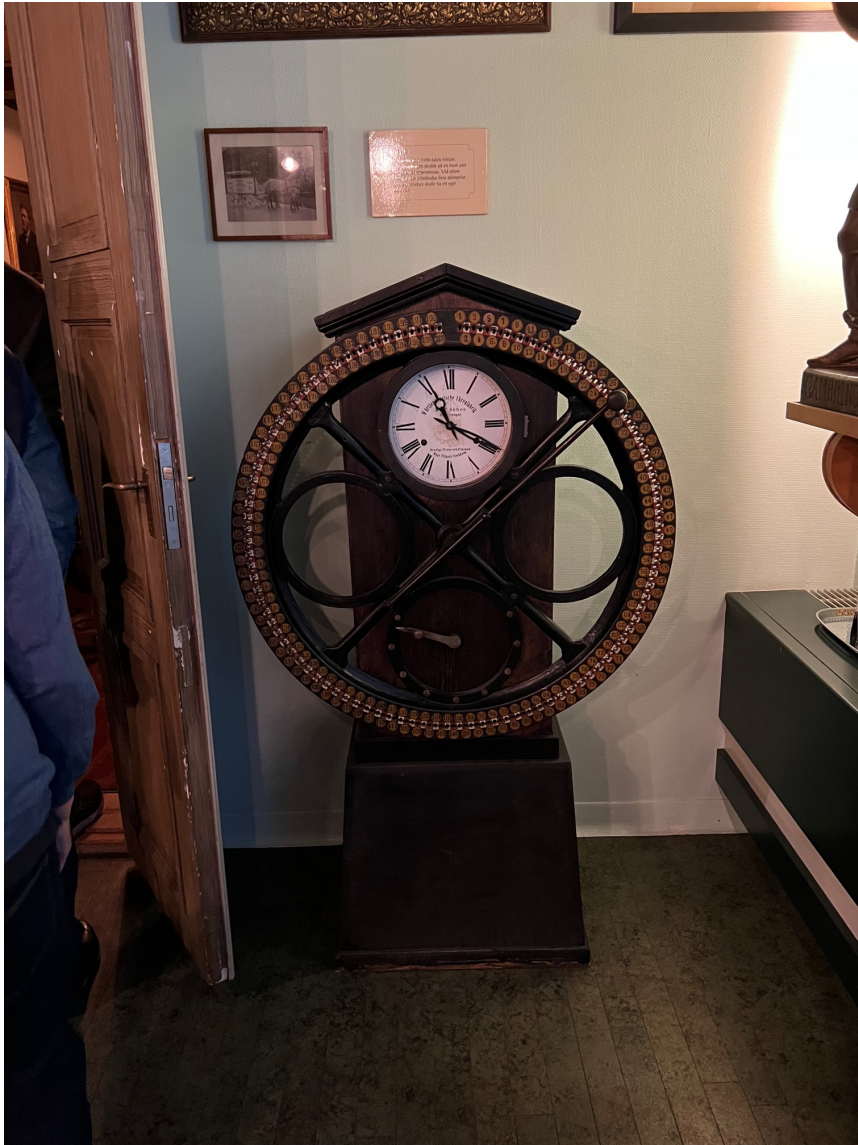
En gammal stämpelklocka.