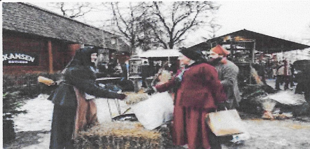
Julmarknad på Skansen

Följ med på vår julstämningsresa till Stockholm.