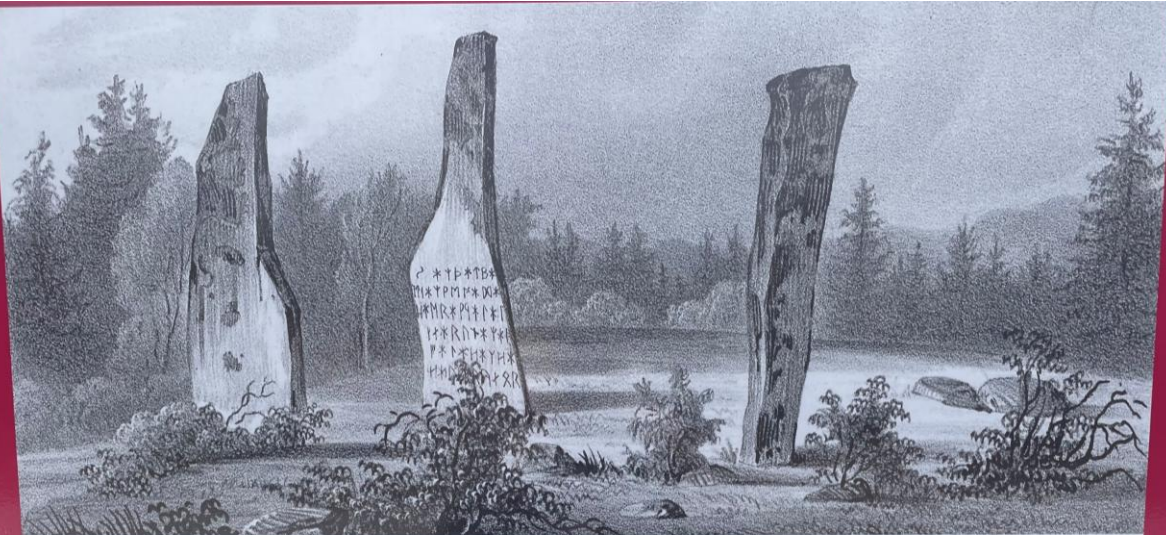
Oversikt över Björketorpstenarna från Mindesmarker fra Hedenhold av Jens Jacob Assmunsen Worsaae 1846.

Här i Björketorp står ett av Sveriges märkligaste forminnen. Det är den näst högsta runstenen i landet och bär på en ovanlig förbannelse.