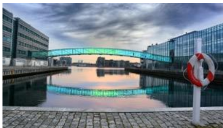
Ljusbrygge vid Islands Brygge