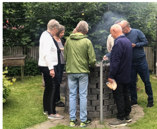
Bilder från pubträffen på Täppan den 15 juni