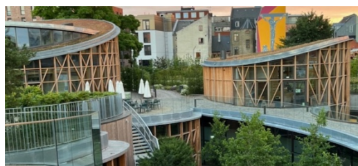
H.C. Andersen Hus