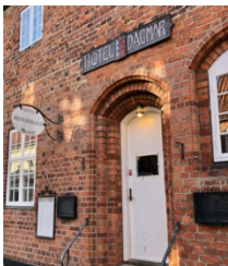
Hotel Dagmar serverar stjerneskud.