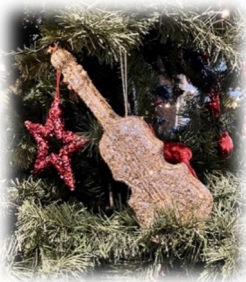
Detalj av julgranen på Malmö Opera