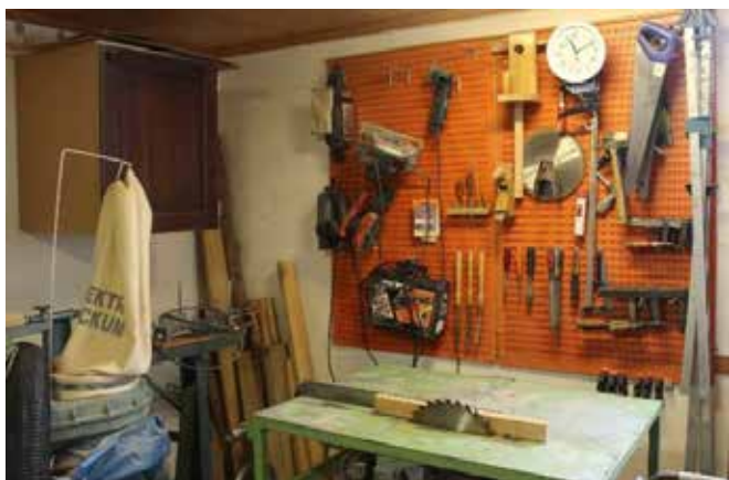
Ordning och reda bland verktygen. Många handverktyg har ersatts av elektriska.

Den ena möbelen efter den andra har sett dagens ljus i källaren. I hemmet finns bland annat: hörn-skåp, TV-bänk, skrivbord, bokhyllor, bord och stolar samt hallmöbler.