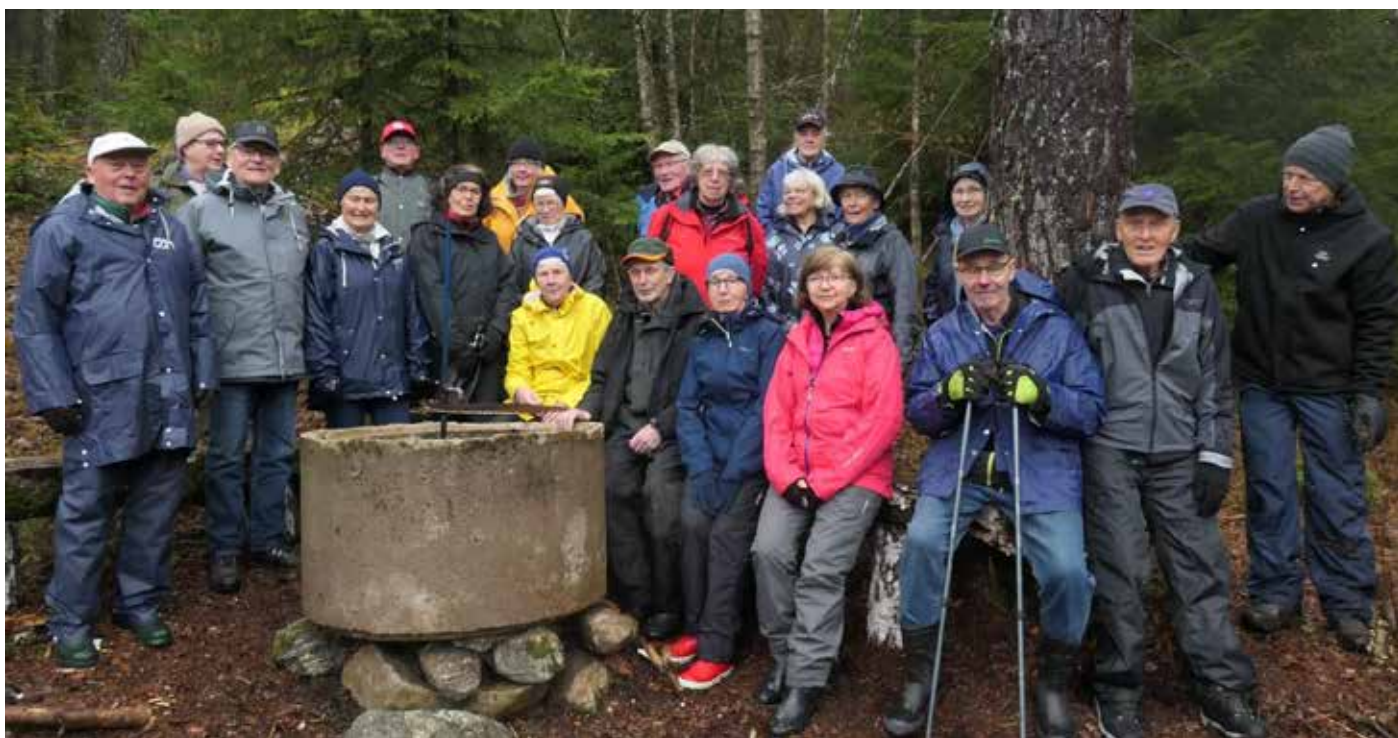
Det regnade när vi gick i skogen på Stuvängen. Alla var väl utrustade med regnkläder. Här vid grillplatsen vid Fedjavattnet hade varit en perfekt fikaplats ... om det inte regnat.