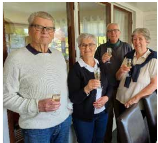
I glasen finns alkoholfri bubbel!

Nu har vi avverkat den 50:e promenaden! Den avslutade vi med att bli bjudna på lunch på restaurang Lillemor i Spånslätt.