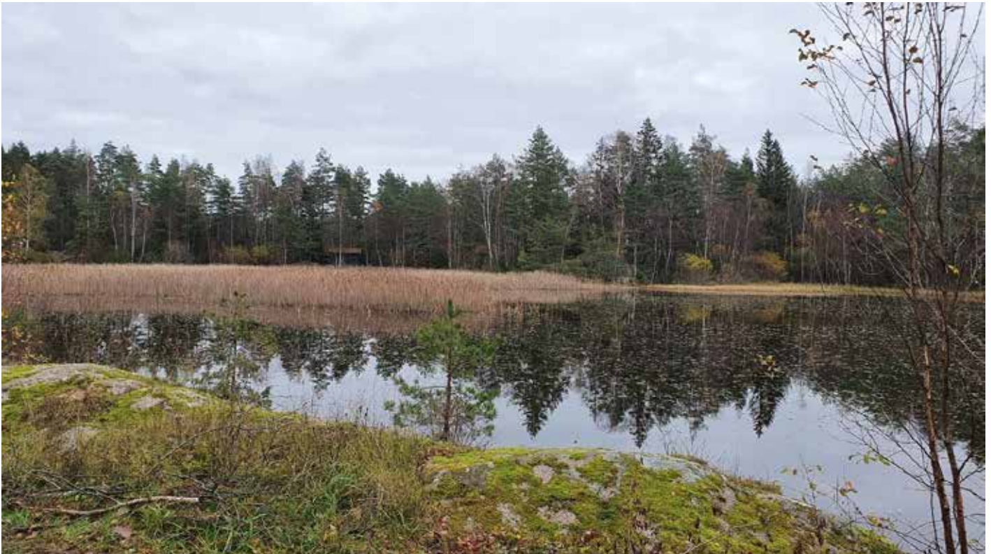
3:e pris i vår fototävling 2021. Husbergsmýren.