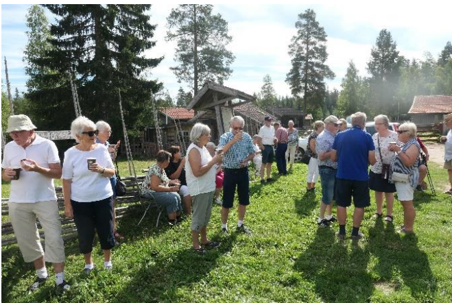
Det blev bussfika vid en fäbod i Tövåsen.

I mitten av augusti åkte 55 personer på en fyra dagar lång bussresa till Dalarna. Första kvällen besökte man Dalhalla och såg och hörde en konsertversion av "Kristina från Duvemåla". Under tiden i Dalarna fick man se flera av de "klassiska" resmålen i landskapet, en fäbod, Karin och Carl Larssons hem i Sundborn och Emma och Anders Zorns hem i Mora. Den som var intresserad av hantverk, kanske något att köpa med sig hem, hade tillfälle att handla vid ett besök på Nittsjö Keramik, Jobs Handtryck eller i Nusnäs, där dalahästar av olika slag tillverkas. På hemresan serverades lunch på vackra och anrika Grythyttans Gästgivaregård.