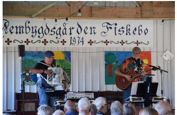
Duon Spelfinkarna underhöll vid månadsmötet.

Sedan blev det dags för den förtäring som föreningen bjöd på, dricka och korv med bröd. Mötet avslutades med ännu en stunds musik och ett lotteri.