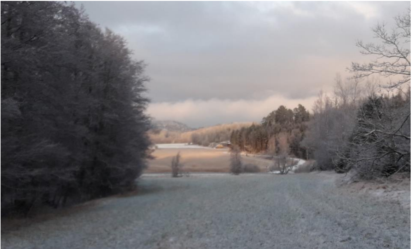
En vinterbild från vår fototävling 2021.