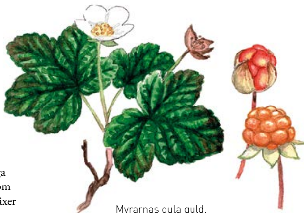
Myrarnas gula guld, hjortronen, finns inte bara i Norrland.

Bara en mindre del av Rösjö mosse ligger i Skara kommun, resten tillhör Vara och Falköping . Den mest välkomnande vägen in går från Varasidan, där man kan parkera vid Bastöna bygdegård , en gränad gammalgård i originalskick från 1860. Därifrån går en vältrampad gammal stig vidare till ett övergivet hemman med jättelika lindar och gamla fruktträd. Stigen fortsätter mot mossen men är omarkerad och blir bitvis otidlig, så en bra karta eller GPS är att rekommendera.