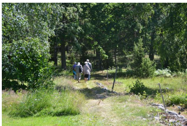
Vandring över ön genom dess vackra natur.