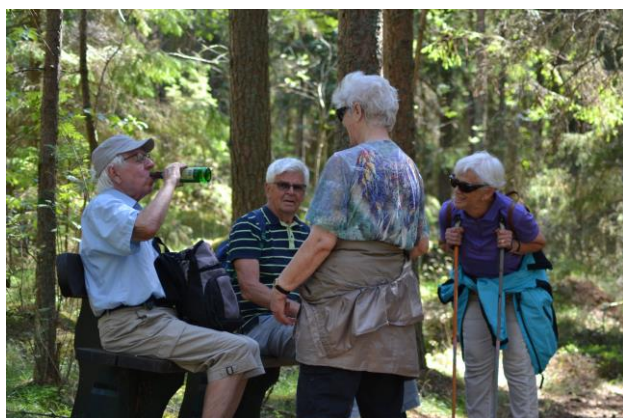
Värmen var tryckande - en välbehövlig vätskekontroll.