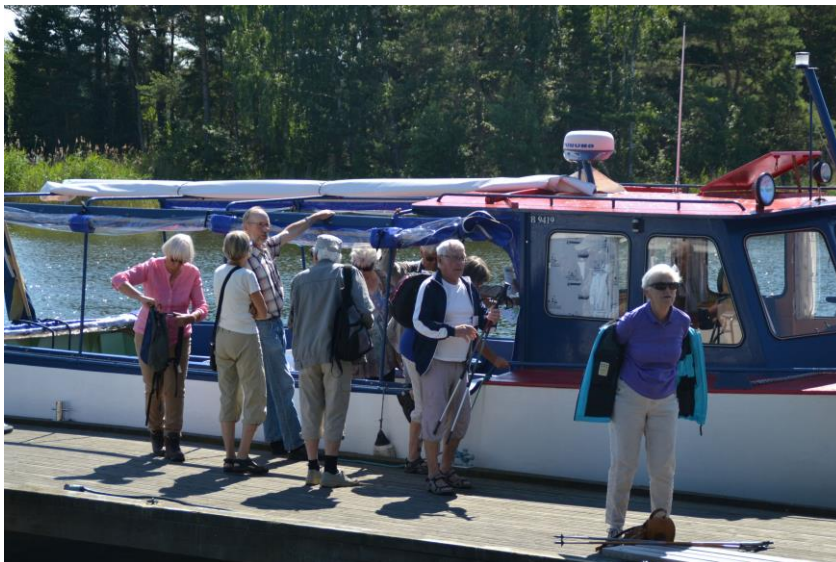
Landstigning Stenkasta tilläggsbrygga.

Flera steg av vid Stenstaka tilläggsbrygga för att sedan vandra över ön till Basteviken där lunchen väntade. Båtarna åkte vidare till Basteviken där de övriga steg av.