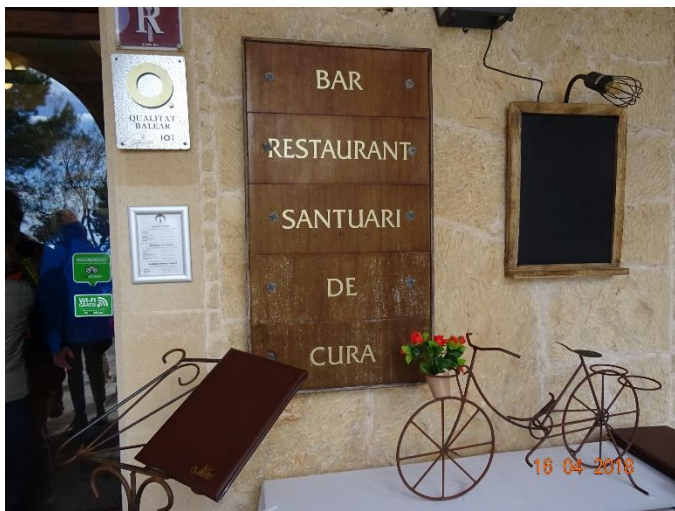
Måndag 16/4 Klostret i Randa och avskedsmiddag med spädgris på Santuari de Cura.