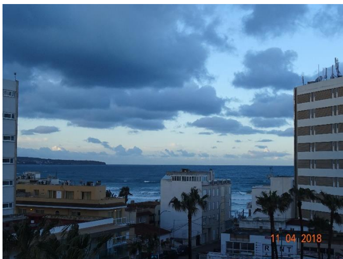
Onsdag 11/4 Utsikt från hotellet efter stormen.

Några bilder från resan till Mallorca den 11 – 16 april 2018.