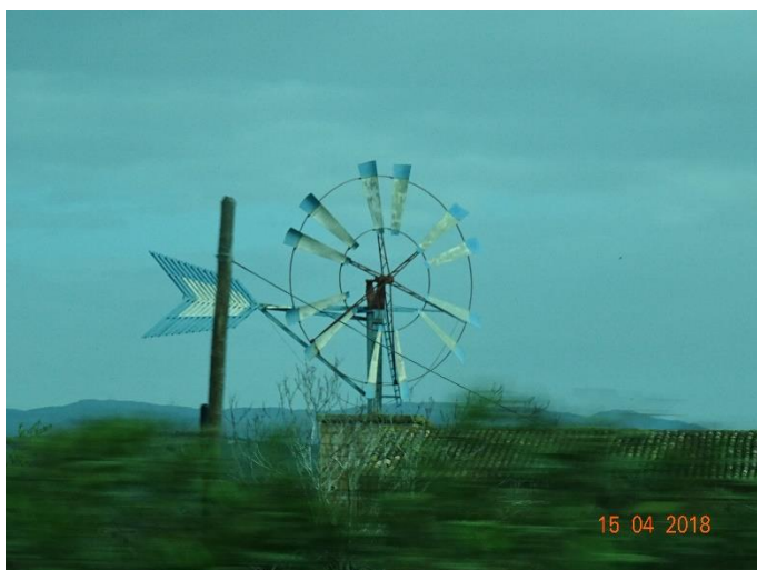
Söndag 15/4 Vindkraft sett från bussen.