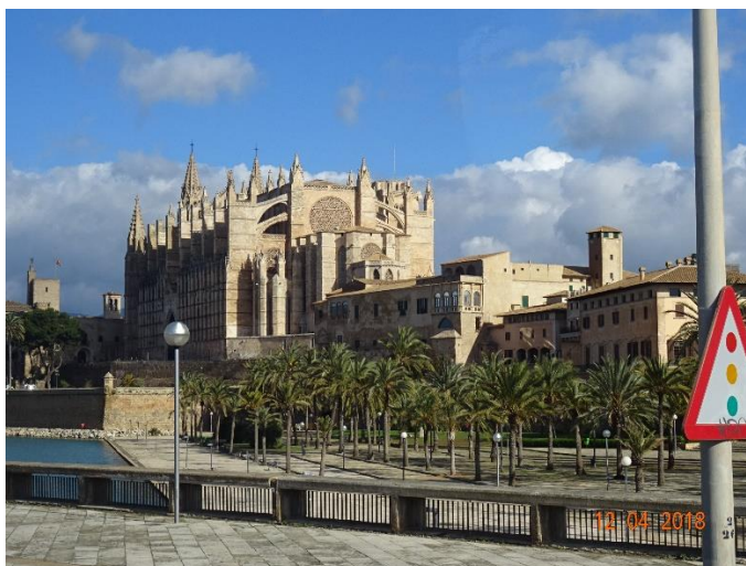
Torsdag 12/4 Gotiska katedralen La Seu.