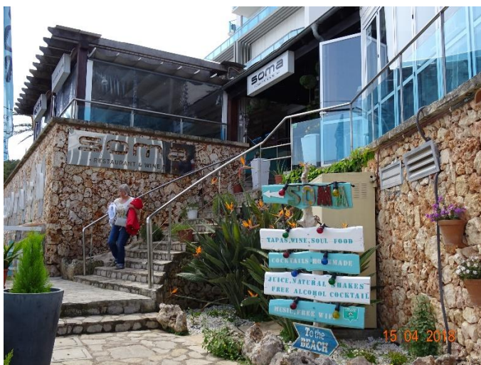
Söndag 15/4 Efter Drakgrottorna god lunch på Soma i Porto Christo. Solen sken!