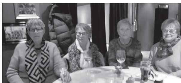
Så här kan det se ut när man vill testa After Work.

dit för att se och lära. En kul och trevlig afton som vi säkert kommer att göra om och som vi föreslår andra att våga prova.