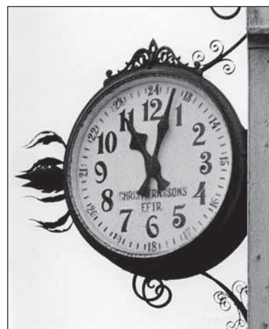
”Krickens klocka” som räddades när Ekmansdalen revs 1972.

”Krickes klocka”, från 1927, försvann när Ekmansdalen revs 1972. Christiernssons urmakeri hade den utanför sin butik. Som av en händelse kunde hembygdssföreningen köpa tillbaka uret av en privatperson som räddat det när Ekmansdalen revs. Idag finns den att beskåda på Karlskoga bibliotek.