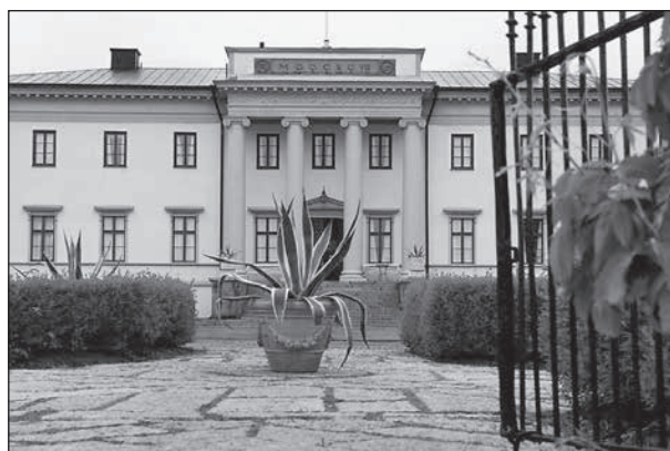
Stjernerunds slott.

Nästa stopp blir Naturens hus som ligger mellan Oset och Rynningevikens naturreservat. Där