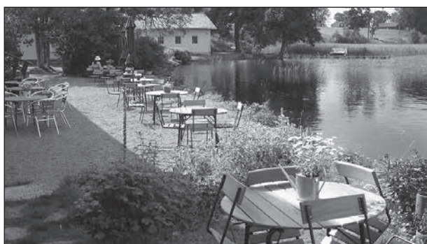
Stjernerunds slottscafé.

Vi åker till Stjernerunds vackra slott nära Askersund. Där vandrar vi runt i den vackra slottsparken som är omgiven av vatten på tre sidor. Den som vill kan gå in i slottet och vara med på en guidad tur för 100 kr. Det finns ett slottscafé nere på bryggan, det är bara att äta och njuta.