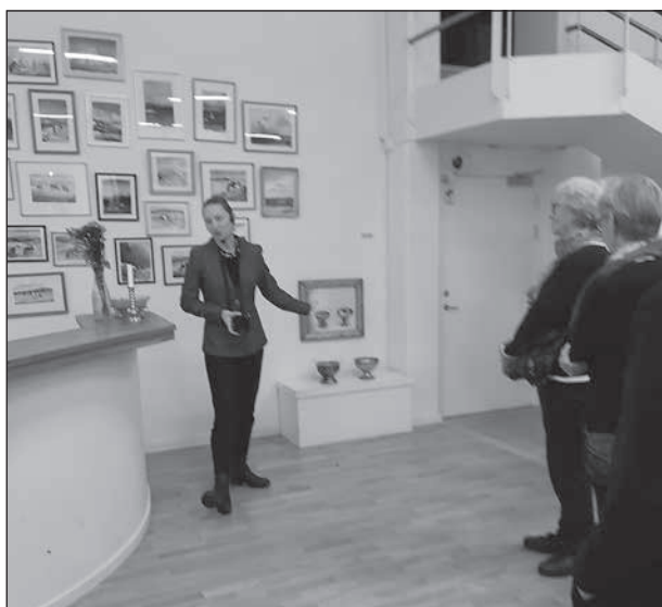
Guiden föreläser om Lerins konstnärskap och hans noggrannhet vad gäller den perfekta hängningen av tavlorna.

Regnet hängde i luften men vad gjorde det när vi, 30 förväntansfulla och nyfikna Lerin älskare gled in på Sandgrund. Vi hann gå en runda först innan guiden samlade oss och började berätta om Lars Lerins liv och måleri. Sedan lotsade hon oss runt och presenterade allt från tidiga tavlor och hur han sedan utvecklats genom studier och mycket målning till den stora mångfald som nu finns på utställningen. Guiden berättade om hur Lars plötsligt en natt hängt om en massa tavlor eller bara dök upp och gick efter henne eller hur han gjorde när någon kom på att en av de berömda delarna av bokhyllan var vänd upp och ner. Han tog ner tavlan hängt den upp och ner igen och spikade fast den. Lars fotade massor på sina resor