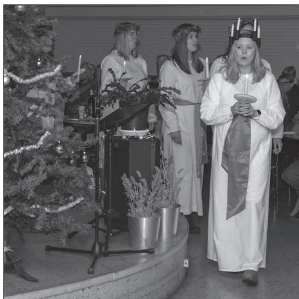
2022 års Luciatåg på Solbringen var väldigt uppskattat.