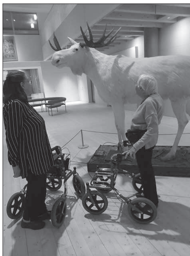
Ett möte med den sällsynta albinoälgen behöver inte ske i storskogen.