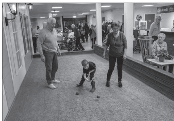
Generationer möts i spelets glädje.