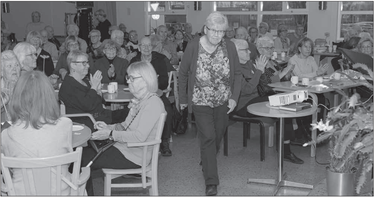
Det serverades afternoon coffee när SPF fyllde 45 år.