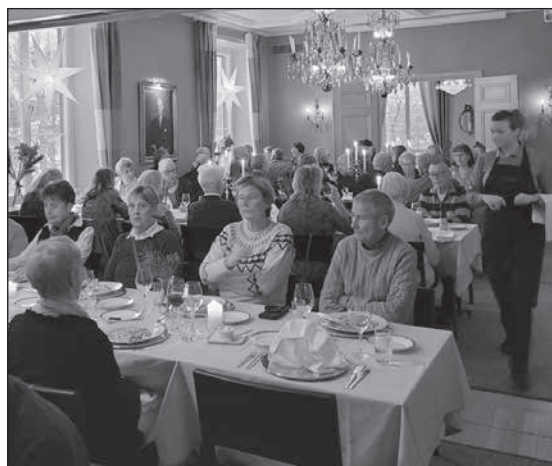
En riktig Nobeldukning vid middagen den 9 december.