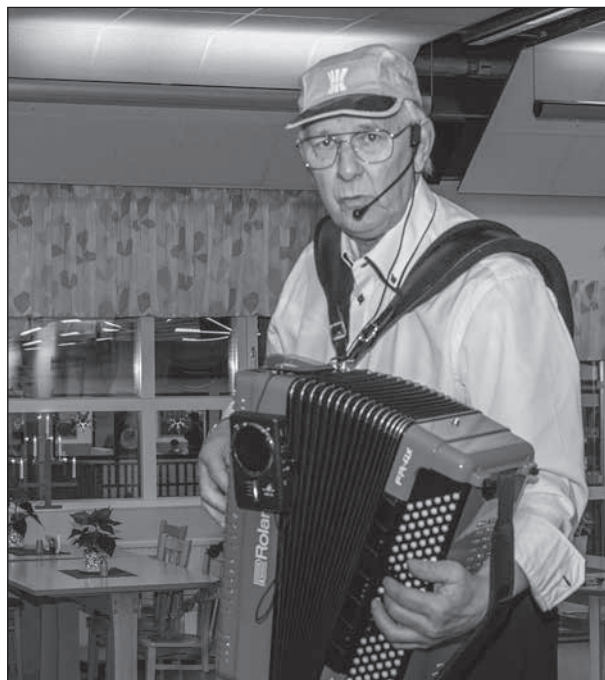
Hässleby-Anders underhöll publiken med "äkta" musik, sång och historier vid vårt gladaåterseende.