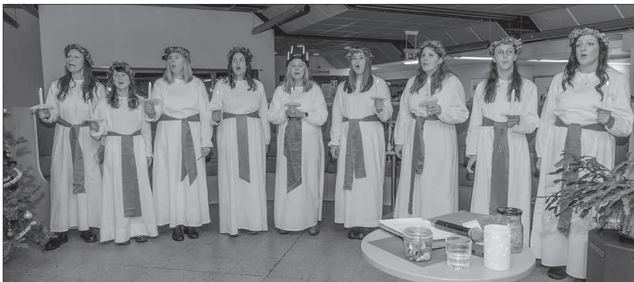
Publikkommentaren var "Oj vad många de var i år". Den minnesgode minns kanske att förraårets lussetåg gästades av corona.