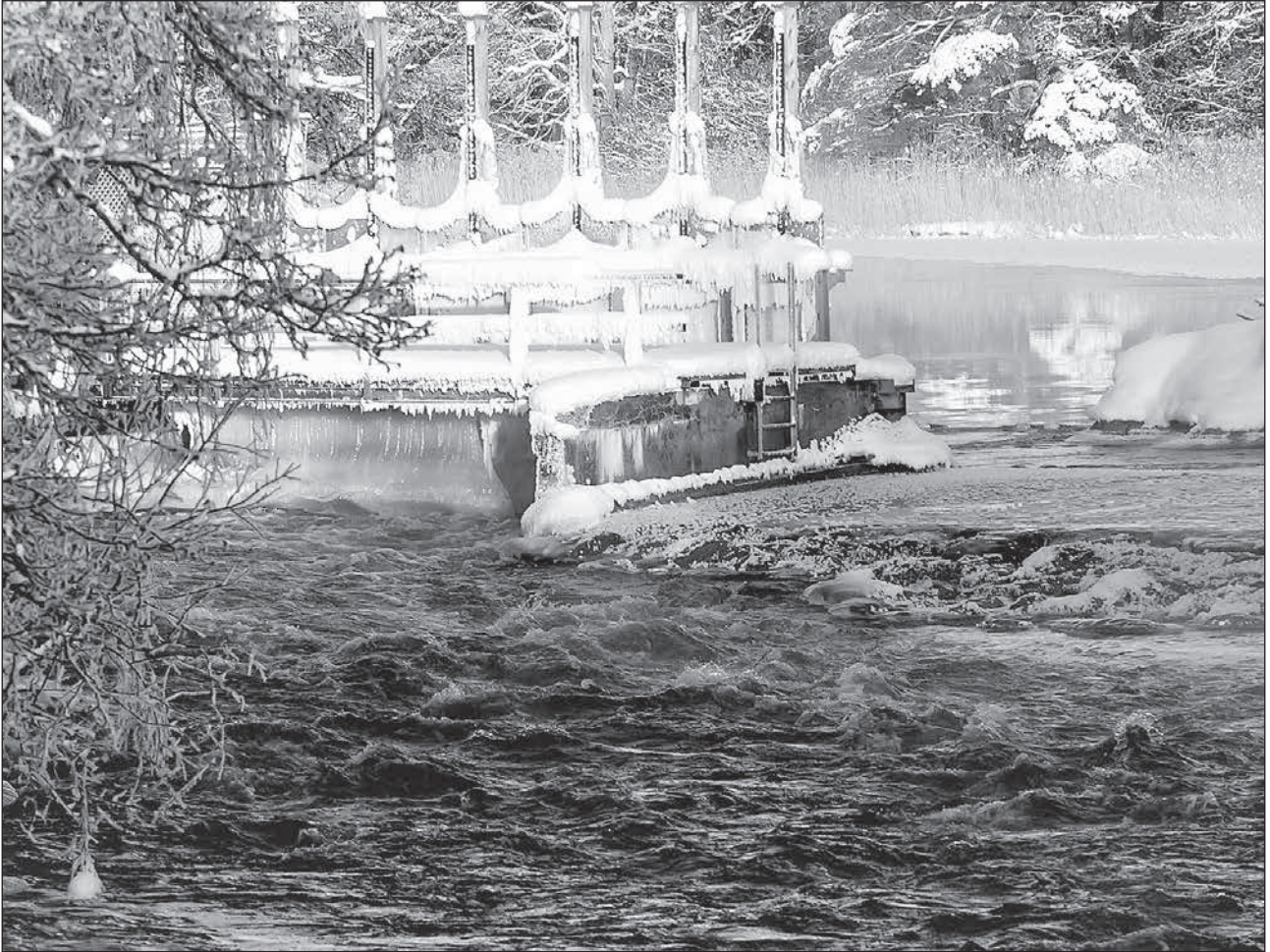
Vinterbild från Lunedet.