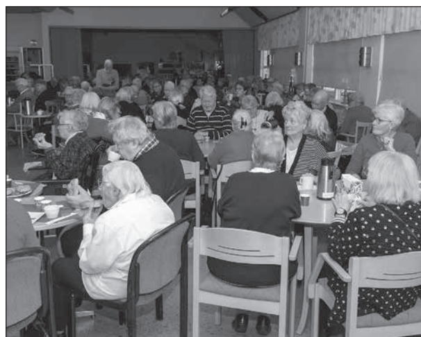
En månghövdad publik uppskattade dagens stämsång.