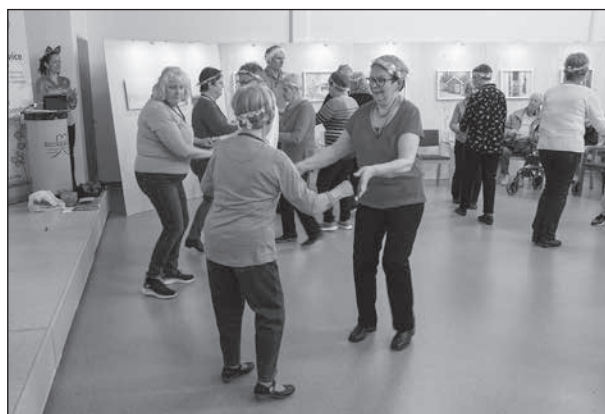
Det blev en uppskattad julmyspremiär på Nickkällan.