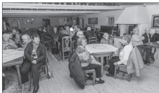
I väntan på dagens kaffepaus i Veboa, Berget.

En kort information om Degerfors vackra vita kyrka (värd ett besök) innan vi åkte mot kul- turcentrum Berget för en fikapaus i Vedboa där kaffemuggar var uppställda på ett bord längst ner i lokalen. Flera personer från SPF Seniorerna bildade