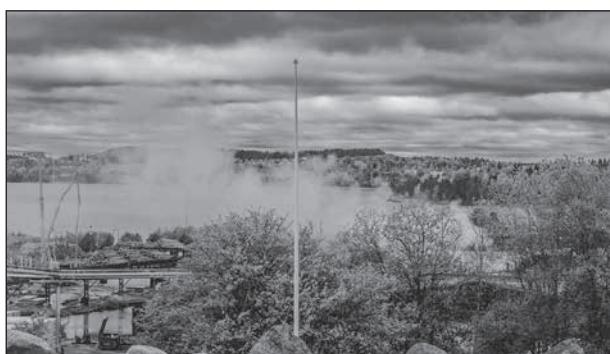
Valåsens sågverk är igång vilket märks på röken från sågverket.

Vi passerade Valåsens sågverk med anor sedan 1500-talet och ägaren Moelven har 130 anställda vid sågverket. Vi hörde om en påbörjad pellets- och energiproduktion inom området. Vi passerade vä- gen nedanför Valåsens herrgård som Selma Lagerlöf gjorde känd genom att skriva om denna i sin trilogi om Löwensköldska ringen. Sven Stolpe hör till de som bott på denna herrgård. Vi fick höra om Valån, vattenbruket och den järnhantering som upphörde runt 1850. Hyttan är sedan länge riven.