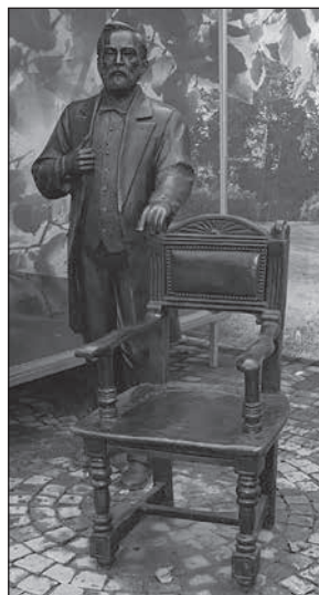
Dagens huvudperson, Alfred Nobel, erbjuder en skön sittplats och observerar sin omgivning.

Han arbetade som kemist i ett flertal olika länder, bland annat i Paris. Han tog över Bofors vid årsskiftet 1893/1894 och bodde under några år i Björkborns herrgård sommartid. Det laboratorium han haft i Paris flyttades till San Remo år 1896 och