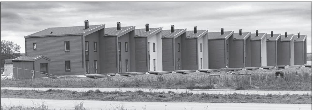
Nybyggda hus längs med färdvägen vid Möckelns strand.