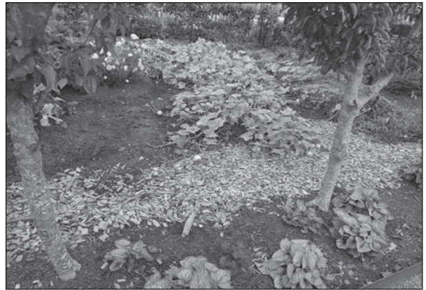
Här ser vi melonsmakande gurkägglarna. Dessa symboliserar jorden.