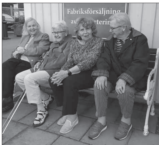
En kvartett nöjda damer pustar ut efter sina inköp.

höngödsel till gödning och solpaneler har satts upp för uppvärmning.