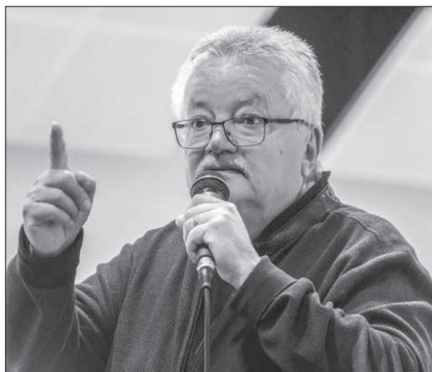
"Ödehusmannen" höll ett spännande föredrag för oss vetgiriga.

Men redan i unga år väcktes intresset för vackra hus. Han har fortsatt med sin dokumentation av olika ödehus i landskapen Närke, Värmland (här