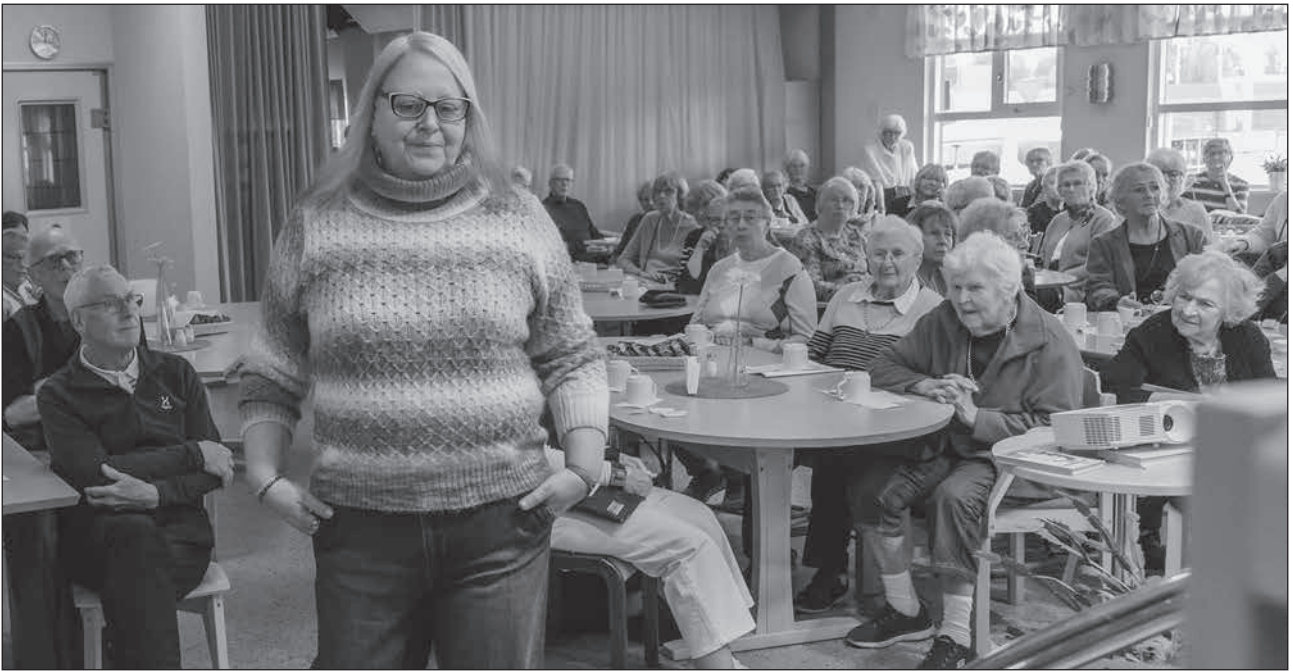
Passande klädsel en blåsig svensk höst.

Det applåderades efter varje visning. Som vanligt harmonierade alla färger och köplusten växte nog hos många denna dag.