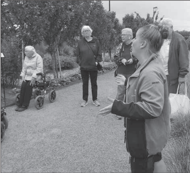
Guiden berättar om allt som sker från plantering ända fram till det färdiga resultatet.