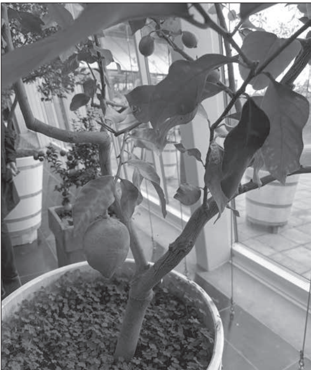
Ett praktfullt citrusträd.