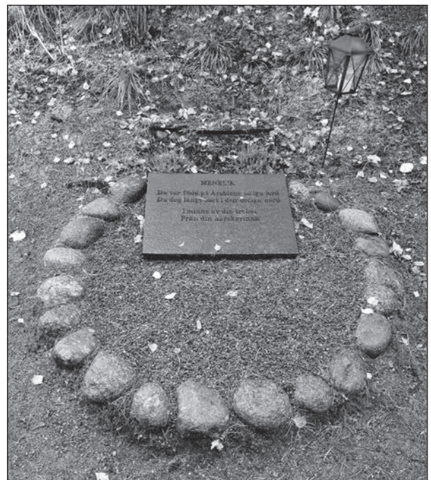
Meneliks vilorum brukar vara fullt med blommor, ljus, presenter i november.