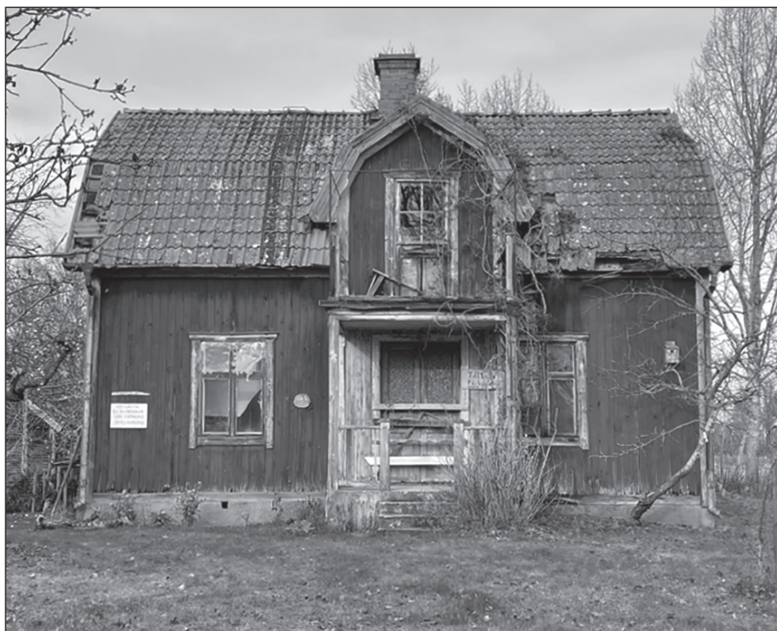
Ett av de vackra ödehusen vi fick se.