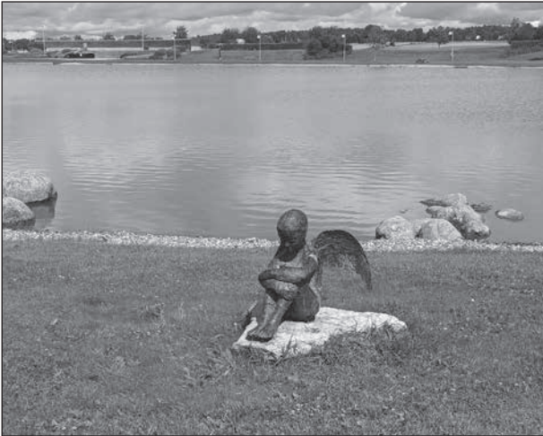
Denna vackra skulptur återfinns nere vid sjön.