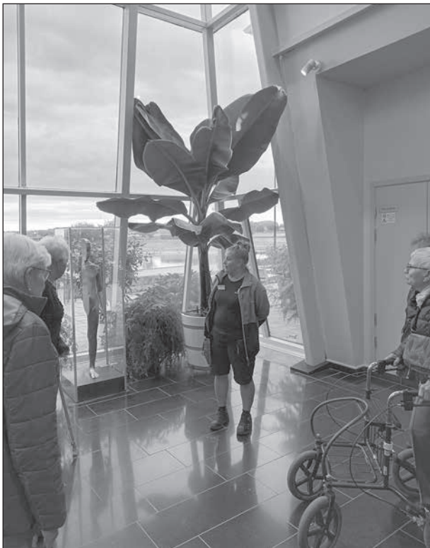
Vår guide berättar om parken, ståendes framför ett bananträd.

Den stora uteparken var uppdelad för att symbolisera de fyra elementen luft, jord, eld och vatten. Guiden förklarade vilka växter som använts och det var intressant att se hur de verkligen lyckats välja rätt plantor för att visualisera rätt element. Elden var sprakande med gula dahlior, röda syrenhortensior och brandgula begonior på stolpar. Jorden hade t.ex. låga rikliga stånd av äppelgurkor,