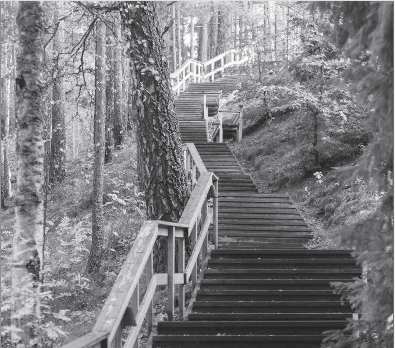
Hälsotrappan finns tätt intill cirkushästens viloplats.