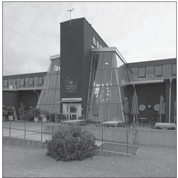
Så här ser entrén vid Kumla Sjöpark ut.

något helt nytt för mig men som nu finns på min köksbänk för avsmakning. Spännande!