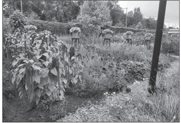
Dessa vackra röda blommor är en symbol för eld.