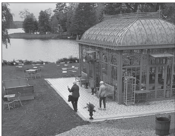
Entrén på Kumla Sjöpark.

Hela tiden moderniseras och förändras både produktion och metoder för hur de stora ägorna ska skötas för att ge bästa resultat. Den halm som förut värmdes upp alla hus plöjs nu istället ner med