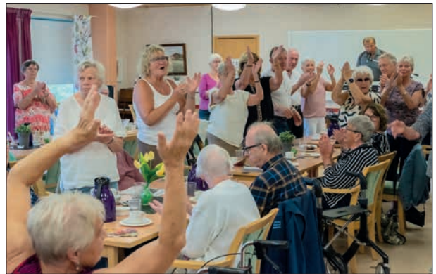
Stämningen verkar vara på topp.