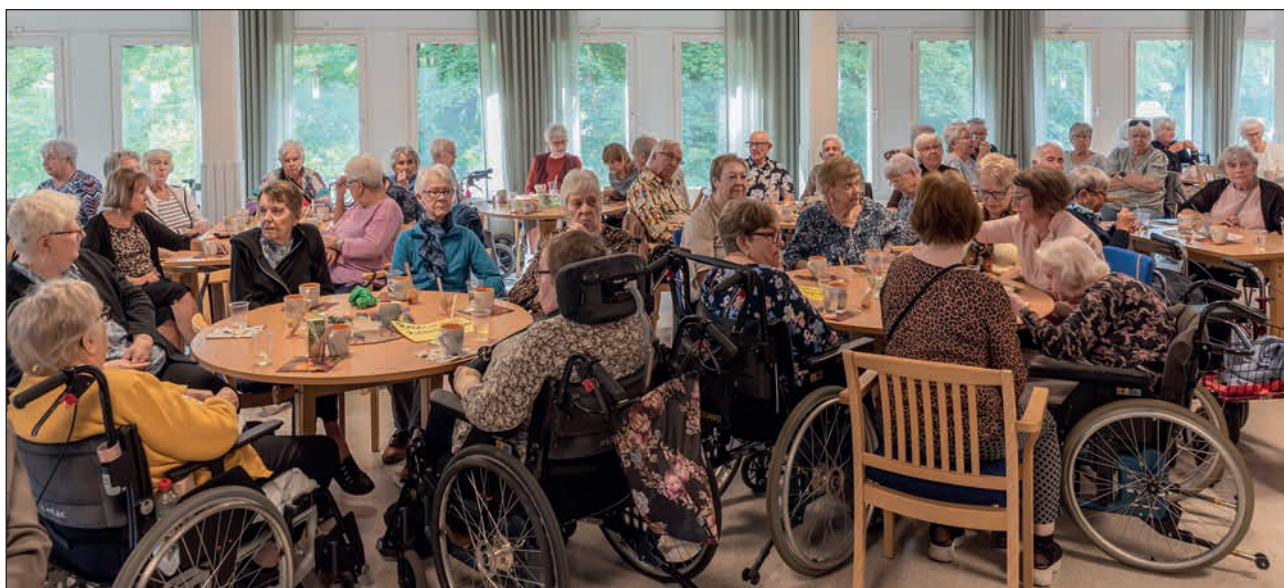
En översiktspild från dagen.