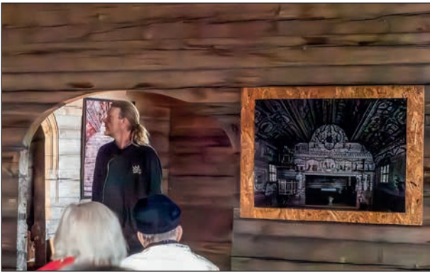
Vår guide står i koret som har en fantastisk akustik.

dagsljus, takkronor med eller utan levande ljus, kändes det först mörkt att komma in i kyrkan. Fönstren som satt en bit upp fyllde sin funktion. Det fanns bänkar vid väggarna att sitta på men många föredrog att nyttja sina rollatorer, andra föredrog att bli stående inne i kyrksalen. Guiden befann sig inne i koret och berättade om arbetet med kyrkan, konstverken mm. Det var en mycket bra akustik och det kändes som vi som var längst ner skulle hört honom även om han viskat. Det ställdes en del frågor och många svar gavs innan vi vandrade ut genom dörren i det lätta regn som föll.