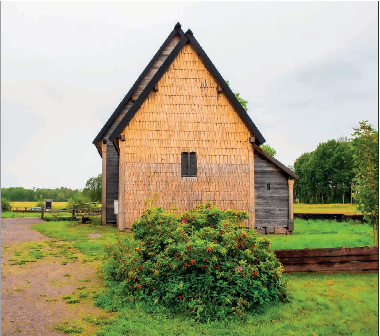
Kyrkan i Södra Råda.

En spännande utflykt till Södra Råda. Sidorna 8-9.