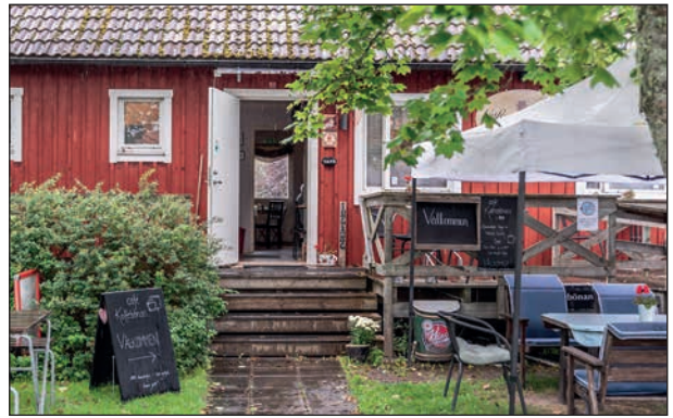
Fikadags i Åtorp efter en spännande och lärorik utflykt.