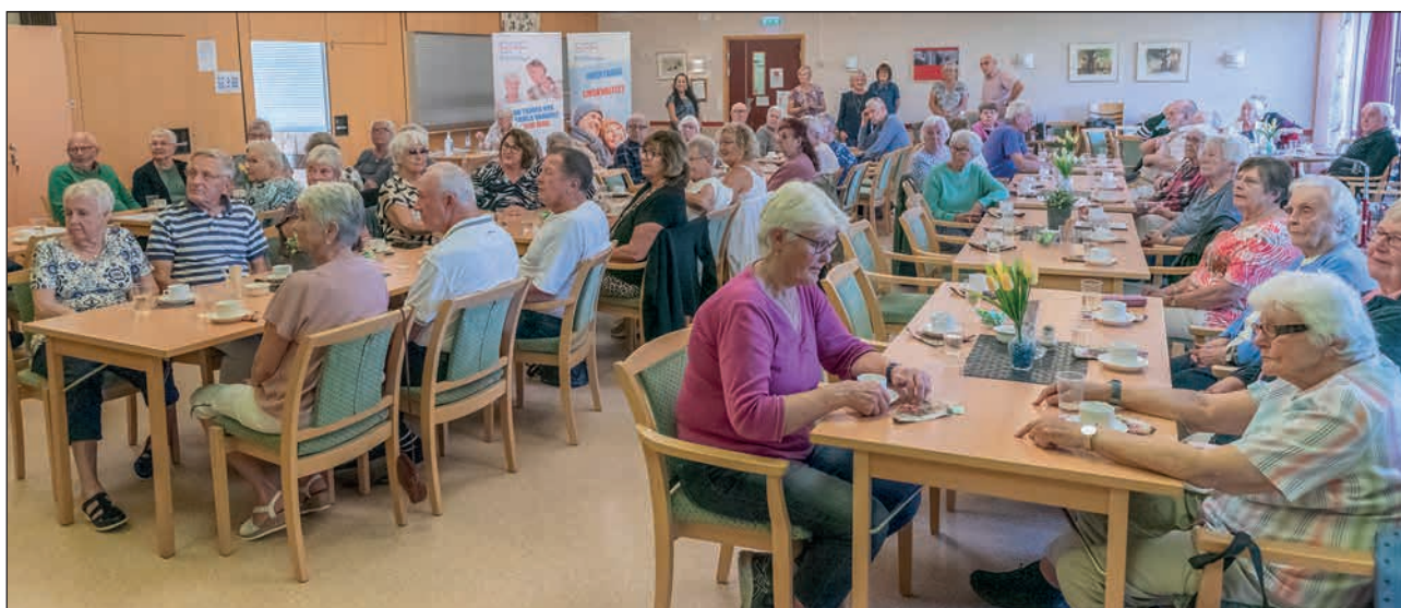
Trevlig samvaro med gott kaffe.