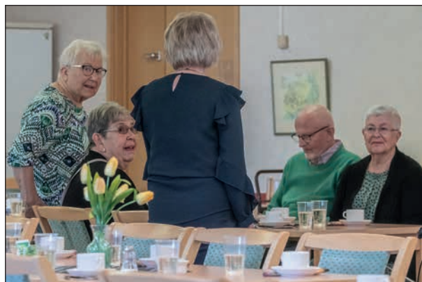
Funktionärerna diskuterar dagens upplägg.