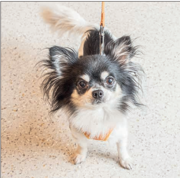
Denna fyrbente herre medverkade tillsammans med matte delar av denna eftermiddag.