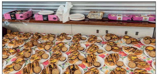
Dagens kakfat som väntar på att få komma ut till borden.

Under kaffepausen, där vi bjöds på stora wienerbröd och havrekaka med choklad, var det dragning på inträdesbiljetterna.