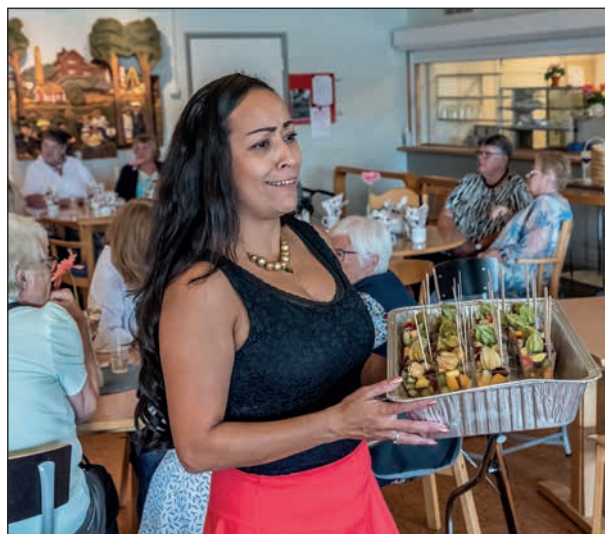
Här sker utdelning av fruktsallad.

har det fallit en del regn så vi tog i samarbete med kontaktservice det säkra före det osäkra och valde att ses inomhus detta år.