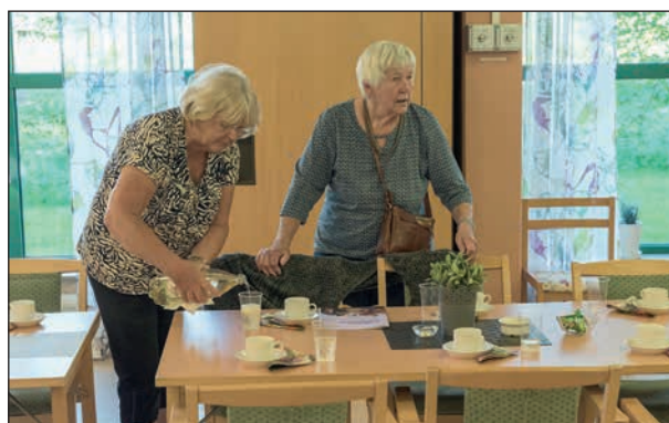
Förberedelser inför dagen pågår.