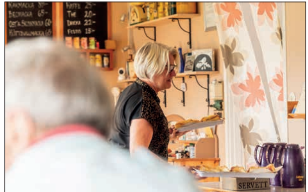
Interiör från café Kaffebönan i Åtorp där vi intog vårt eftermiddagskaffe.

Det fanns informationstavlor om platsen nedanför huset med toaletter. Det fanns en del spännande växter i trädgården som undertecknad gärna tittat lite närmare på då jag funderade på om de kunde ha använts som läkeväxter. (vilket skedde i klostren.)