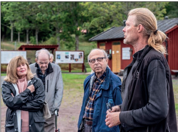
Här ställer några intresserade besökande frågor till vår guide.

dagsljus, takkronor med eller utan levande ljus, kändes det först mörkt att komma in i kyrkan. Fönstren som satt en bit upp fyllde sin funktion. Det fanns bänkar vid väggarna att sitta på men många föredrog att nyttja sina rollatorer, andra föredrog att bli stående inne i kyrksalen. Guiden befann sig inne i koret och berättade om arbetet med kyrkan, konstverken mm. Det var en mycket bra akustik och det kändes som vi som var längst ner skulle hört honom även om han viskat. Det ställdes en del frågor och många svar gavs innan vi vandrade ut genom dörren i det lätta regn som föll.