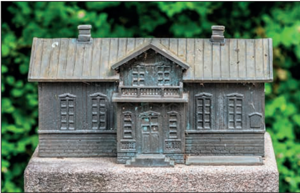
En modell av gamla tingshuset finns att beskåda vid konsthallen.

Från början var denna plats arrestlokal och vaktmästarbostad åt intilliggande tingshus, vilket är mest känt för att Alfred Nobels testamente lagfördes där.