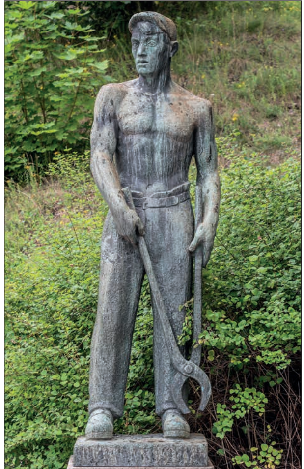
En gjuteriarbetare kunde se ut så här förr i tiden.

Tingshusparken har under det senaste året genomgått en renove-