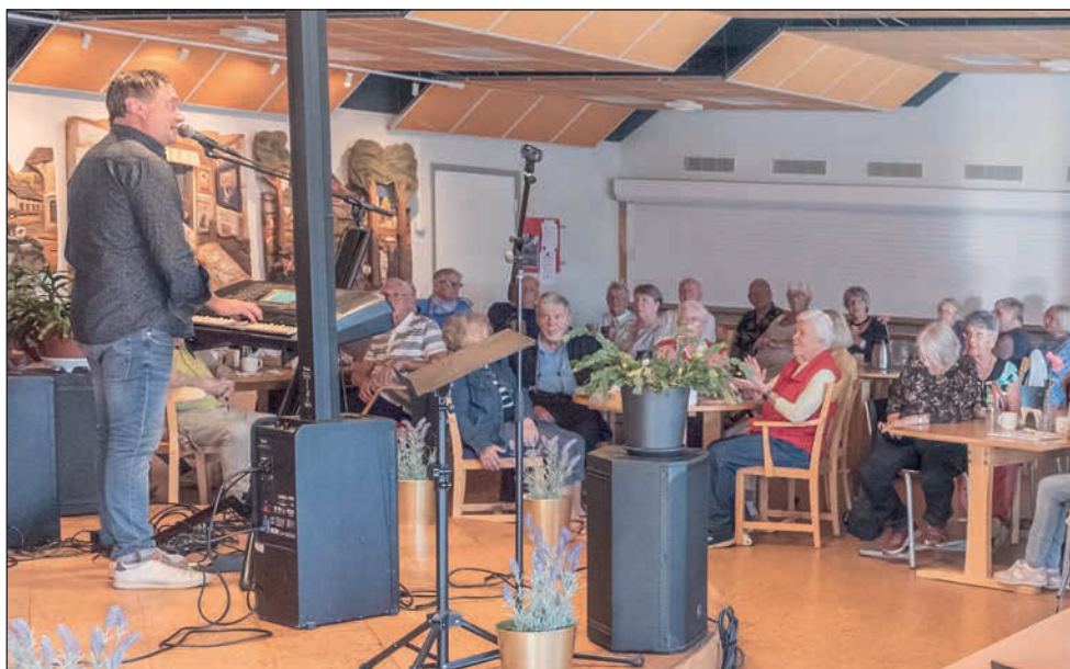
En mycket populär artist som vid månadsmötet kände igen delar av publiken från sommarträffarna.