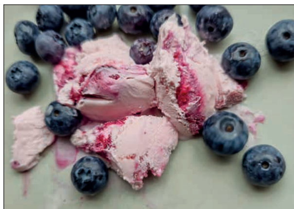
Blåbär och glass en god kombination.

Blåbär kan användas till mycket, kanske mer än många av oss känt till.