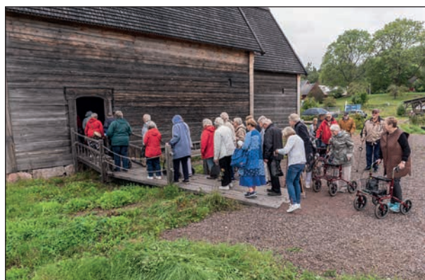
Vi är på ingång till den återuppbyggda kyrkan.

Att komma in i kyrkan kändes som att gå in i en helt annan värld. Vi som blivit vana med kyrkor med många och stora fönster som släpper in