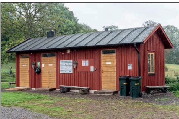
Ett litet hus med toaletter.