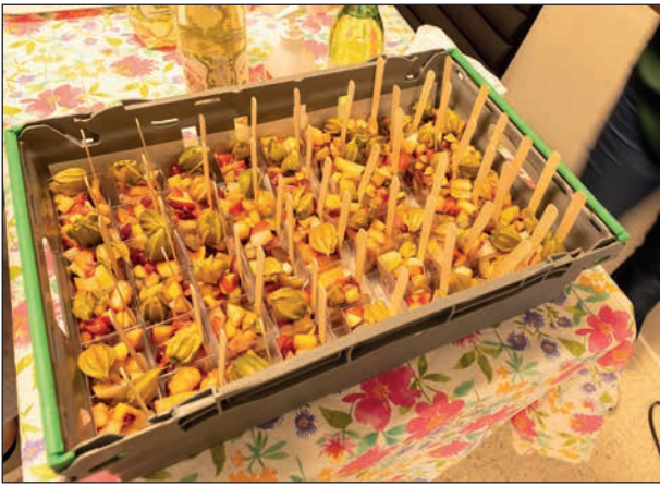
Dagens fruktsallad är klar för servering.