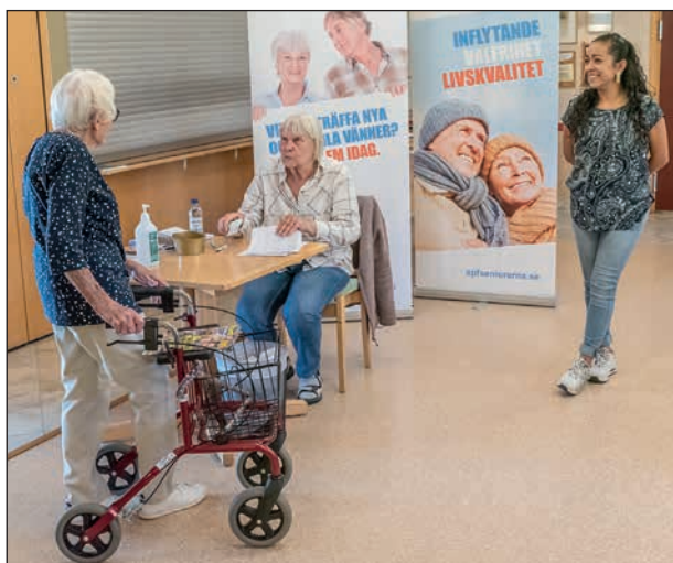
Dags att bli avprickad innan man går in.

Dagen startade med Tomas Ledins ”Sommaren är kort”. Många hade nog önska ett annat sommarväder än det vi haft i år. Vi fick bjöds på blandad musik från många olika artister som Bonnie Taylor, Elvis Presley, Per Myrberg, John Denver, Åge Aleksandersens ”Lys och verme” fast på svenska, Sven Ingvars, Sten & Stanleys signaturmelodi som