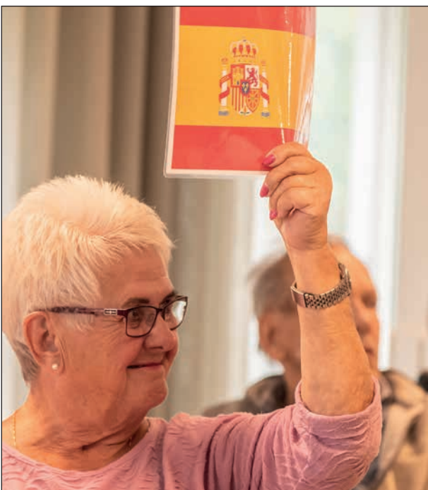
En av alla de flaggor som var utlagda när vi kom.