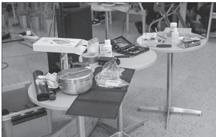
En krislåda kan vara bra att ha i beredskap.

Den som ville fick också titta vad som fanns i en krislåda som kan vara bra att ha.