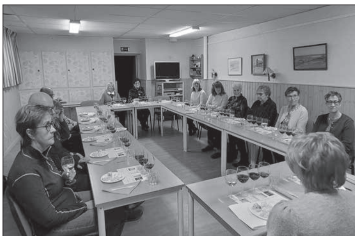
En repris på en populär vin- och ostprovning ägde rum den 2 mars på Träffen.