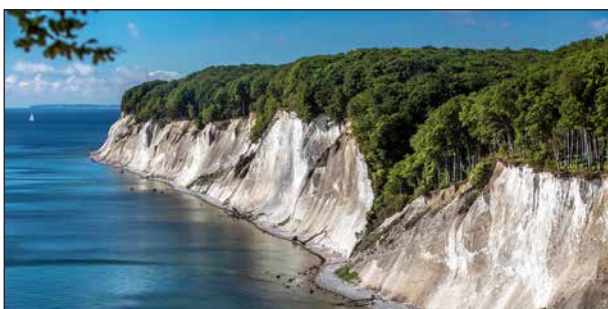
Rügen med sina vita klippor är Tysklands största ö.

4 dagars kryssning Gotland – Bornholm – Rügen med Birka Cruises