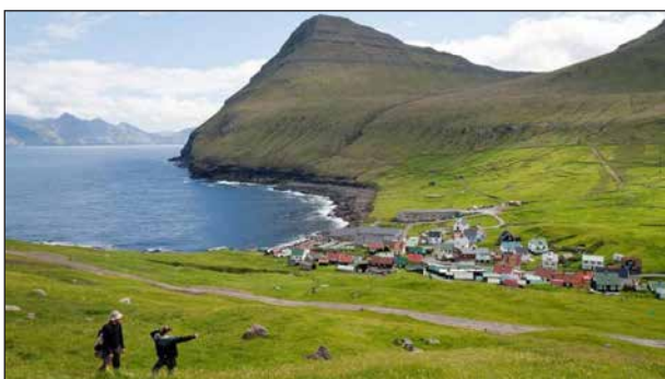
Färöarna, ett vilt och kargt landskap.

8 dagars kryssning till Färöarna och Island (Vikingakryssning)