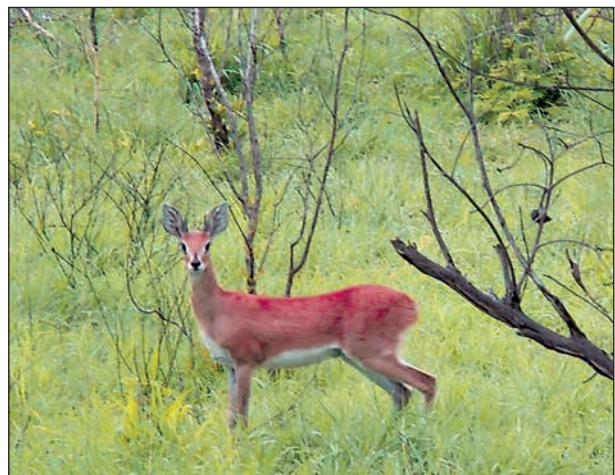
Den här gracila skönheten stod naturligtvis inte stilla, men vad gör en smula oskärpa när man är så vacker?