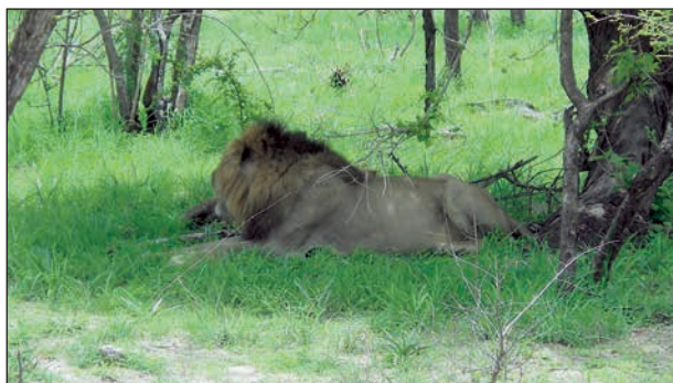
Man kan behöva vila lite efter en stadig antiloplunch. Att många jeepar med turister samlas är inget att bry sig om för en kung.

Flera gånger var vi ute på jeepsafari. Den mest fantastiska upplevelsen var när vi åkte iväg i jeep omkring klockan fem på morgonen. Jeepförarna hade radiokontakt och anropade alltid varann när det var något extra att se.