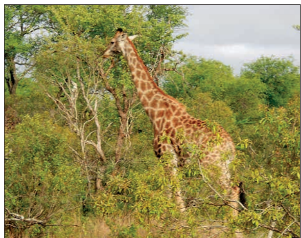
Giraffer vill inte så gärna vara med på bild, men den här hade inte alltför bråttom.