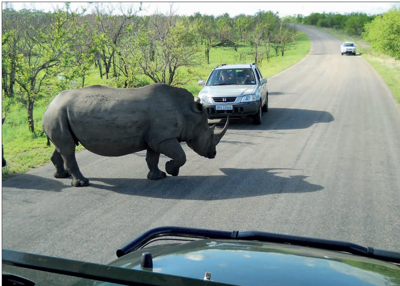
Man vill ju försöka ta sig över fast man är rätt stor och klumpig.

Under den del av resan då djurlivet studerades bodde man i en s.k. lodge. Den såg ut som en hydda som smälte in i miljön men var utrustad med allt en bortskämd svensk kunde behöva.