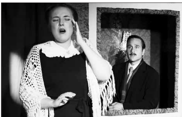
Stor dramatik med flera mord i en komplicerad historia.

Vi som följde med till Lerbäcksteatern (20 st) fick en bra och klurig mordgåta och bra rolltolkningar i full fart.