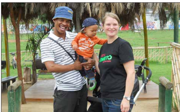
Glad guide med son och fru från Salbohed.

I ett av dessa slumområden fick vi guidning av en ung sydafrikan. Hans fru var svenska och besöket inleddes med en utmärkt lunch i deras lilla restaurang.