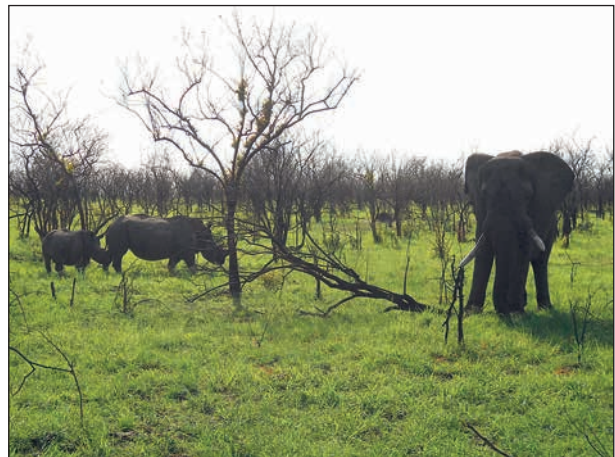
Det lär inte vara så vanligt att kunna fånga elefant och noshörning på samma bild, men här gick det bra.